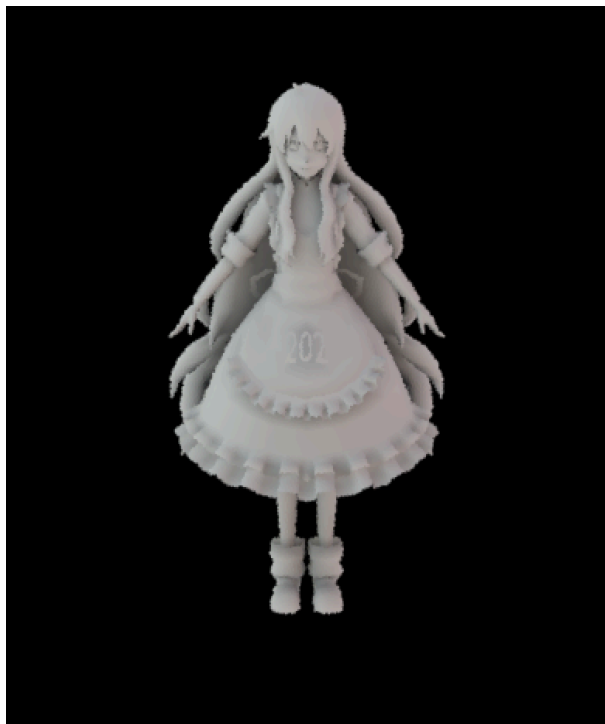
图 1: 预计算 Debug 图片

PRTIntegrator::Li(const Scene *scene, Sampler *sampler, const Ray3f ray 实现了可视化球谐系数结果的方法,如果在 PRTIntegrator::preprocess(const Scene *scene) 中正确预计算得到环境光球谐系数和传输项球谐系数，那么这个函数将会在 GUI 中绘制出一个着色后的模型，如图1所示，你可以在预计算阶段通过显示的图形来 debug 你的预计算代码。