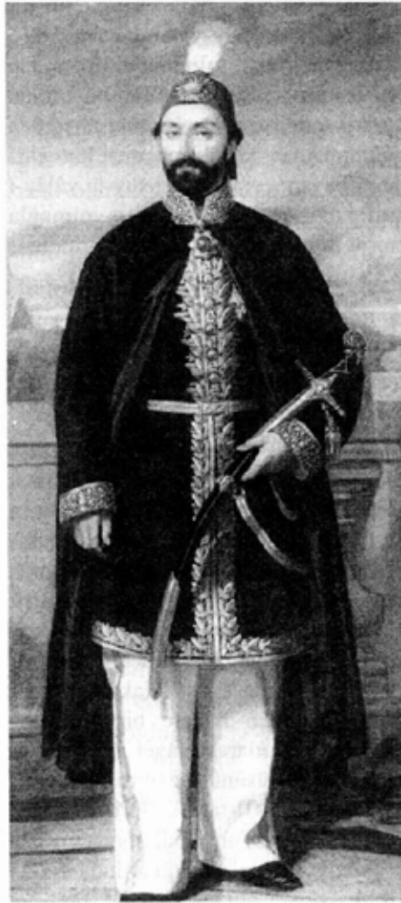
31. Osmanlı padişahı Sultan Abdülmecid (1823-1861).

Sadrazam Mustafa Reşit Paşanın Sultan Abdülmecid'e yazdığı arz tezki-