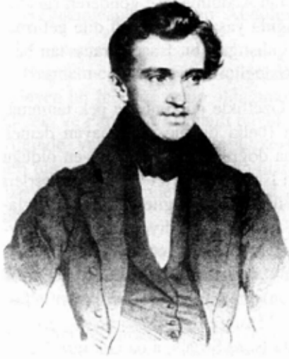
Johann Strauss (baba) (1805-1849)

Avrupa'nın dört bir köşesinde turneye çıkmış olan Johann Strauss (baba), Fransa'yı ilk ve son kez 1835 senesi sonu ve 1836 senesi başında yer alan bir turnede ziyaret etti. Johann Strauss henüz 30 yaşındaydı. 4 Ekim 1835 tarihinde 26 kişilik, küçük sayılabilecek ama yetenekli müzisyenlerden oluşan bir orkestra ile Viyana'dan Paris'e doğru yola çıktı. Fransa'ya geçmeden önce Münih, Ulm ve Stuttgart'da konserler verdi. Sonunda 19 Ekim tarihinde de Ren nehrini geçerek Strazburg'a vardı ve burada çaldı. Dokuz gün sonra da orkestrası ile beraber Paris'e ulaştı. Strazburg'da verdiği ve coşkuyla karşılanan konserinin haberleri kendisinden önce Paris'te duyulmuştu. Zamanın Paris'i özellikle Musard, Auber, Cherubini, Halévy, Berlioz, ve Meyerbeer gibi müzisyenlerin saltanat sürdüğü ve kadri'l'in dans olarak popüler olduğu bir