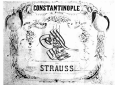
Strauss'un Sultan Abdülmecid'e gönderdiği parçaların ilki. İthaf. 'haşmetmeap Sultan Abdülmecid'e' ("A sa Hautesse le Sultan Abdul-Medjib"). İstanbul Üniversitesi Kütüphanesi, envanter numarası 781/208.

Strauss tarafından Abdülmecid'e gönderilen bu matbu nota koleksiyonundaki eserlerin arasında "Souvenir de Gènes" ve "La Médaille d'Or" adlı parçaların kapak sayfaları özellikle ilginç. Derlemede bulunan diğer bütün eserlerin bestecisi olarak sadece "Strauss" yazılı olduğu halde, bu iki parçada besteci ismi "J. Strauss" olarak yer alıyor. Ama ne başbakanlıktaki belgelerde, ne de bu gönderilen notaların herhangi bir yerinde, baskı, mühür, ya da imza olarak "Johann Strauss" ifadesinin kendisini bulamıyoruz. Bunun bir önemi olabilir mi?