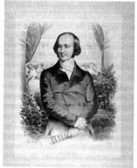
Isaac Strauss'un gençliği

Isaac'ın 1801 doğumlu Maurice adında bir erkek kardeşi, ve Hirschel adlı bir adamla evlenen Rachel adlı bir de kızkardeşi vardı. İki erkek kardeş beraber keman çalmaya meraklıydılar. Strazburg'daki müzik okulu ücretsiz olduğu için ikisi de bu okula yazıldı.