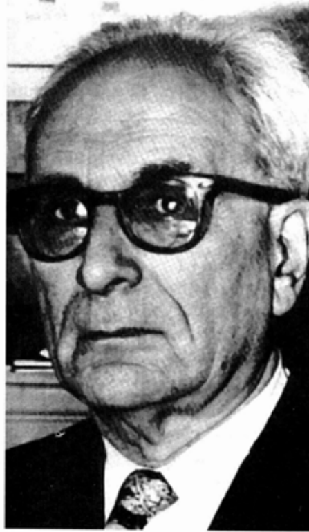
Isaac Strauss'un kızının torunu; modern antropolojinin kurucusu sosyolog Claude Lévi-Strauss (doğumu 1908).

Paris'te Rue de la Chaussée d'Antin, 44 numaradaki apartmanına çekilen Strauss, burada geriye kalan yıllarını ailesi ile sakin bir hayat yaşayarak geçirdi. Henriette Schriber ile olan evliliğinden 5 kız çocuğu olmuştu. Bu kızlardan ikisinin soyundan gelen tanınmış kişiler vardır: 1842'de doğan kızı Léa, Levi ile evlendi. Lea'nın torunu ünlü yapısalcı düşünür, etnolog, sosyolog, ve modern antropolojinin kurucusu sayılan Claude Lévi-Strauss'tur (doğumu 1908). Lévi-Strauss'un Türkçe'ye de çevrilen eserleri arasında İrk Tarih ve Kültür, Yaban Düşünce, Hüzünlü