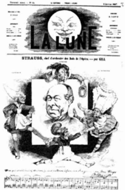
"Les clodoches". Isaac Strauss'un yönettiği gösteri ile ilgili 6 Ocak 1867 tarihli "La Lune" gazetesinde yer alan haber.

vanlarına "Operanın Maskeli Balolar Şefi" de ekledi. Bu maskeli balolar bütün kış boyunca sürer ve karnavala (Şubat ayına rastlayan ve hristiyanların büyük perhizlerinden önce gelen eğlence zamanı) kadar devam ederdi. Bu maskeli baloların kurucusu ünlü Philippe Musard'dı (1793-1859). Musard hem