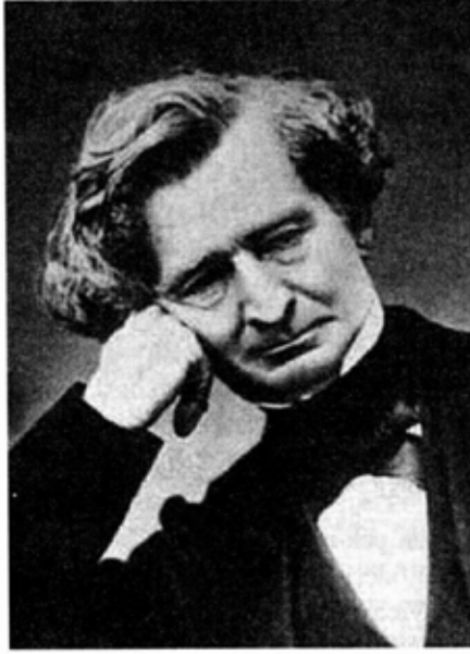
Hector Berlioz (1803-1869)

"Paris'te bir tane Strauss var, bu Strauss'un da bir kardeşi var 4 ; Viyana'da da bir Strauss var, ama o Strauss'un kardeşi yok! Bu ikisinin arasındaki tek fark. Strauss isimli iki müzisyen olması şanssızlığından başlayarak operakomikleri ve aristokrasinin verdiği bütün baloların müziğini inanılmaz bir coşku ile yöneten bu bizim Strauss'unumuzun başına gelmeyen yok sayı-