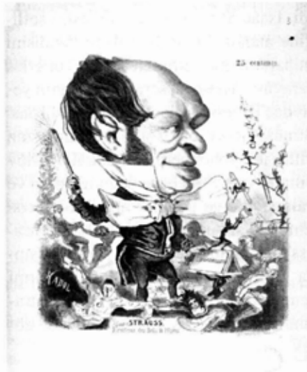
Isaac Strauss'un karikatürü

Isaac Strauss bir müzisyen ve besteci olmanın yanısıra çok aktif bir koleksiyoner idi. Tarihçi Amédée Boudin'in Panthéon de la Légion D'Honneur'de yazdığına göre Strauss'un kaliteli anti-