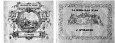
Strauss'un Sultan Abdülmecid'e gönderdiği notalar arasında bulunan "Souvenir de Gènes" ve "La médaille d'Or" bestelerinin kapakları.

Başbakanlık Arşivinde 1964'de bu belgelere rastlamanın verdiği heyecan ortadadır. Rauf Tunçay'ın neden otomatik olarak notaları yollayan besteciye Johann Strauss'u yakıştırdığını da anlamak zor değil. Gerçekten de gerek Johann Strauss (baba) (1805-1849), gerek de Johann Strauss (oğul) (1825-1899), zamanlarının büyük müzik üstadları olarak dünya çapında üne sahip