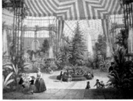
Isaac Strauss'un orkestra şefi olduğu Kış Bahçesi (Jardin d'Hiver), Paris 19. yüzyıl ortası, taşbasması resim (Deroy/Lemercier)

Balo ve büyük partilerdeki başarısının yanı sıra Strauss aynı zamanda hayır kurumları yararına da ücret almadan birçok konser veriyordu. 1853 senesinde İmparator III. Napoléon İspanyol Montijo dükünün kızı Eugénie (Marie Ignace Augustine de Montijo) ile evlenmişti. Aynı sene İmparator ve Eugénie'nin iradesi ile Fondation de l'Hospice de Chantelle (Allier'de) adlı bir hayır kurumu kuruldu. Bu Isaac Strauss'un, yararına ücretsiz çalıştığı hayır kurumları arasında yer alır. Daha önce de bahsetmiş olduğumuz gibi, Strauss aynı zamanda Paris'te verilen opera ve operakomiklere her sınıftan