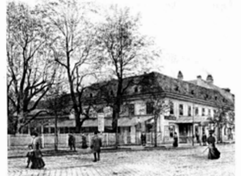
Johann Strauss (oğul)'un Viyana'da 15 Ekim 1844 tarihinde ilk konserini verdiği Dommayer gazinosu.

Ünü sonradan babasının ününü bile geçecek olan Johann Strauss (oğul) ise Viyana'da 25 Ekim 1825 tarihinde doğ-