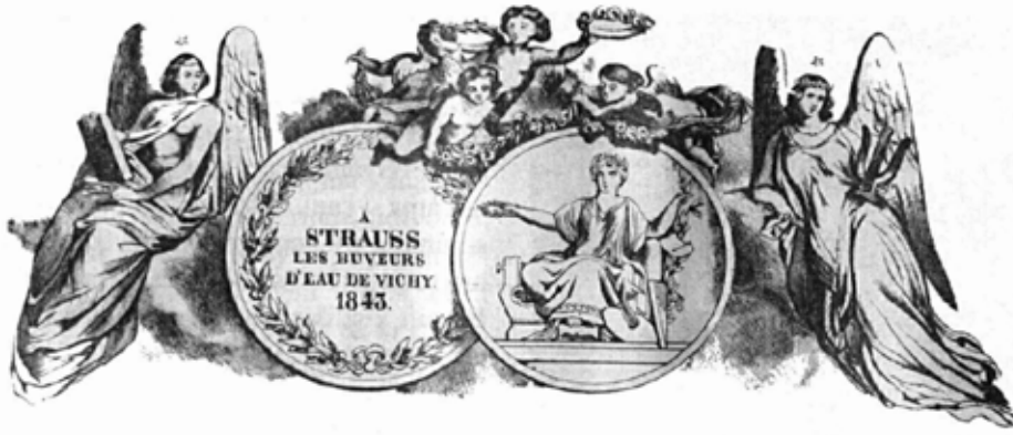
Isaac Strauss'a Vichy anısı olarak Vichy kaynak suyu içenler (Buveurs d' Eau de Vichy) adına verilen altın madalya (medaille d'Or).

bilen bir kişi. Onun yeteneği ve atımları sayesinde şehir eski zenginliğine ve parlak devrine tekrar dönecek" şeklinde değerlendiriyordu.