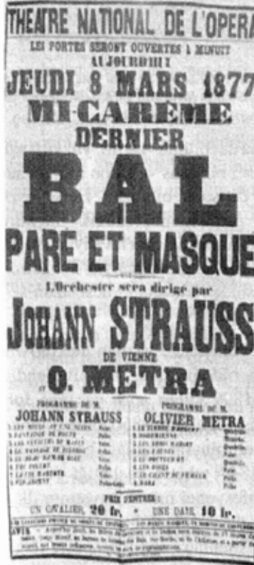
Johann Strauss (oğul) ve Viyana üzerine afişler: Viyana'lı (de Vienne, (Fransızca), di Vienna (İtalyanca), from Vienna (İngilizce)) sözcüğünün kullanıldığını görüyoruz.

Crittenden'in kitabında Strauss ve Viyana'nın kültürel olarak eşleştirilmesi üzerine detaylı bir çalışma kabul edilebilecek olan "Austria personified": Strauss and the Viennese Identity" adlı bir bölüm de bulunmaktadır. Kitapta ayrıca Paris ve Viyana arasında gerek şehir olarak, gerekse de Prusya ve Avusturyalılar arasındaki gerginliğin bir sonucu olarak 19. yüzyılın ikinci yarısında nasıl müziğe çok kuvvetli bir şekilde yansayan bir rekabet olduğu da anlatılmaktadır.