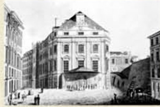
Viyana Kärnthnerthor konser salonunun 1858 yılında dış görünüşü.

Duport konser afişinde Beethoven'ın da sahnede yer alacağını yazarken Viyanalı müzikseverleri çok uzun bir süredir Beethoven'ı sahnede görmedikleri için üstadın da prömiyerde yer alacağı haberinin dinleyici sayısını arttıracığını düşünüyordu.