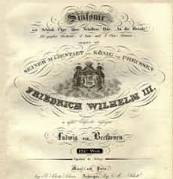
Beethoven'ın Op. 125, Dokuzuncu senfonisinin B. Schott, Mainz ve Paris tarafından 1826 yılında yayımlanan ilk baskısının kapağı. Eser Prusya Kralı III. Frederick Wilhelm'e (1770-1840) ithaf edilmişti. Kralın bunun karşılığında Beethoven'a gönderdiğini yazdığı parlantalı yüzük Viyana'da bestecinin eline geçtiğinde üzerinde sadece ucuz bir yakut bulunmaktaydı. Önce küplere binen Beethoven sonunda yüzüğü bir kuyumcuya sattı.

Bu tarihi konserle, Beethoven 1812'den yana orkestra ile beraber halkın önüne ilk kez çıkmış olacaktı. Aksilikler yüzünden bütün orkestra ve koro ile sadece iki prova yapılabilirdi. Bu nedenle konserin ne kadar başarılı olacağını kestirmek zordu.