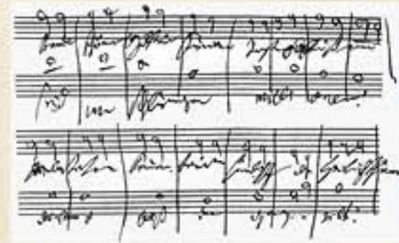
Dokuzuncu senfoninin vokal partiyonunun ilk eskizleri.

Bonn'daki çocukluk yıllarından başlayarak hayatı boyu sanatçının arkadaşı olan Franz Gerhard Wegeler'e Viyana'dan gönderdiği 29 Haziran 1800 tarihli bir mektupta besteci şöyle yazıyor: "Kendimi daha kuvvetli ve sağlıklı hissediyorum ancak kulaklarımda sabaha akşam süregelen bir uğultu ve çınlama var. Günlerim perişan geçiyor, itiraf etmeliyim ki son iki sene boyunca kimseyle görüşmedim, çünkü kimseye 'ben sağırım' diyemem. Eğer başka bir mesleğim olsaydı bu kadar kötü görünmezdim, ama benim işimde bu berbat bir durum. Sonra bir de çok sayıda düşmanım var, onlar ne demezlerdi ki? Bendeki sağırlıkla ilgili biriki şey söyleyebilirim sana. Konser salonunda orkestranın çok yakınında olmazsam icracıları duyamıyorum, eğer uzakta olursam çalgıların ve şarkıcıların tiz sesleri benim için yok. İşin ilginç yanı benimle konuşurken bu durumumu farketmeyenlerin olması. Genellikle dalgın ve unutkan birisi olduğumu düşündüklerinden halimi buna yoruyorlar. Bazan alçak sesle olan konuşmaları hiç mi hiç duymuyorum. Sesleri duyduğum doğru ama kelimeleri çıkaramıyorum. Buna karşı birisi bağırarak konuşacak olsa buna da hiç dayanamıyorum. Bana ne olacağını Allah bilir."