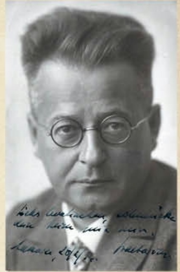
Dokuzuncu senfoninin Ankara prömiyerinde Riyaseticumhur Filârmonik Orkestrası'nı yöneten şef Ernst Praetorius.

detaylı bilginin metni, Beethoven'in hayatı üzerine resimli bir yazı, şef Ernst Praetorius'tan senfoni hakkında birkaç söz, üstat Cevad Memduh Altar'ın "Beethoven Dokuzuncu Senfoni'yi nasıl yazdı?" başlıklı yazısı ve Viyanalı şair Franz Grillparzer'in 1827'de Beethoven'in mezarına taşkonma töreninde okunan söylevinin Türkçesi yer alıyor.