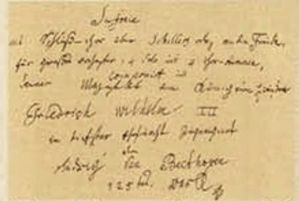
Beethoven Dokuzuncu senfonisini Prusya Kralı III. Frederick Wilhelm'e ithaf etmişti.

Bonn doğumlu olan Beethoven, 1792 yılından itibaren Viyana'da yaşamış, 57 senelik yaşamının son 35 yılını bu şehirde geçirmişti. Beethoven geçinmesi zor bir kiracıydı. Üstad'ın Viyana'da bu 35 yıl içinde tam 72 kez taşındığı biliniyor. Yani aşağı yukarı senede iki kez.