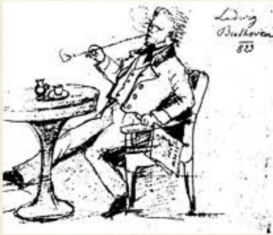
Eduard Klosson'un 1823 tarihli karikatürü Beethoven'ın Viyana'da bir kahvehanede piposunu içerken gösteriyor.

Bunlara ek olarak üç trombon, kontrafagot, pikolo, üçgen, ziller ve büyük davul da orkestrada yer verilen çalgılar arasında bulunuyor.