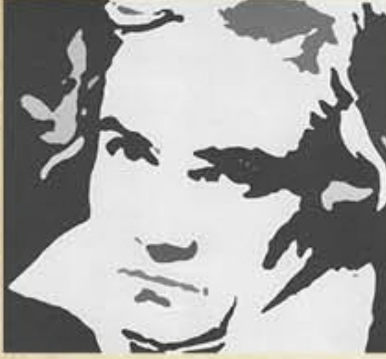
Ludwig van Beethoven.

Scherzo bölümünde trampetlerin başlattığı Ritmo de tre battute alkışlarla kesildiği için baştan başlamak zorunda kaldı.