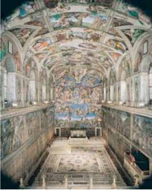
Sistine Şapeli Korosu'nun normal olarak söyledikleri salon. Bu salonun tavanındaki ünlü freskolar Michelangelo tarafından yapılmıştı.

Farinelli: Şöhretinin zirvesindeyken İspanya'da birkaç yıl geçirdi. İspanya kralı V. Philip tahttan çekilip yerine oğlunu geçirdikten sonra, genç kralın kısa zamanda ölümü ile tekrar dönüp makamına oturmak zorunda kalmıştı. Kral ıleri derecede melankoliden ve depresyondan muzdaripti. Devletin en önemli işlerine bile bakamıyordu. İkinci eşi kraliçe Elizabeth Farnese, 32 yaşındaki Farinelli'yi Madrid'e davet etti. Kraliçe'nin hazırladığı mizansen ile Farinelli'nin şarkılarını - sanki şans eseri gibi - başka bir odada olan, Philip'e dinletti. Farinelli'nin müziği ile kendini bir anda çok daha iyi hisseden Philip, büyük paralar, hediyeler ve payeler vererek sanatçının Madrid'te kalmasını sağladı. Kral, Farinelli'nin Madrid'e gelmesinden sonra dokuz sene daha yaşadı. Söylentilere göre, Madrid'te kaldığı bu süre içinde Farinelli Philip'e her akşam aynı dört şarkıyı söylüyordu. Bunların ikisi kesin biliniyor: Hasse'nin Artarse (1730) operasından "Pallido il sole" ve aynı operadan "E pur questo dolce amplesso". Diğer iki parçanın ne olduğu, sanatçının her gece söylediği dört esere ek olarak kral için repertuarından başka aryalar da söyleyip söylemediğini bilmiyoruz.