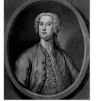
G. F. Handel's kastratları Senesino (Francesco Bernardi, 1686-1758) ve Carestini (Giovanni Carestini, 1704-1760).

Handel, Londra'da süperstar Farinelli ile hiç çalışmadı - hatta Farinelli Londra'da Handel'e rakip bir opera topluluğunda söyledi - ama kastratlar Senesino ve Carestini, Handel'in eserlerinde önemli roller aldılar. Handel, özellikle kontralto kastrat Senesino için çok sayıda rol yarattı. Bunlardan ilki "Radamisto" operasındaydı. Daha sonraki yıllarda Handel, özellikle Senesino'nun söylemesi için bir düzineyi aşkın operada roller besteledi. Bunların arasında, Giulio Cesare, Tamerlano'da Andronico, Rodelinda'da Bertarido, Floridante ve Ottone sayılabilir.