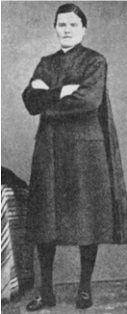
Domenico Mustafa'nın 1850'lerden bir fotoğrafı.

Peki Domenico Mustafa gerçekten Türk müydü? Bunun cevabı hayır. Hem babası hem de annesi İtalya'da Perugia'da yaşamış İtalyan ailelere mensuptu. Bu bilgiler doğum belgesinde bulunuyor. Kendisinden "Türk" olarak bahseden herkes, Doğu'da bir yerden olup batı Avrupalı olmayanları, yani devrin Osmanlısını kastetmişse, o zaman belki bu ailenin köklerinin Kuzey Afrika'ya, belki de Osmanlı'nın 15. yüzyıl sonundaki İtalya seferlerine gittiği düşünülebilir. Ne yazık ki bu tamamen spekülasyon oluyor. Mustafa'nın "Türklükle" bağlantısı olduğunu gösterecek hiç bir yazılı belge, delil yok. Ancak Domenico Mustafa'nın yaşamı zaten oldukça ilginç.