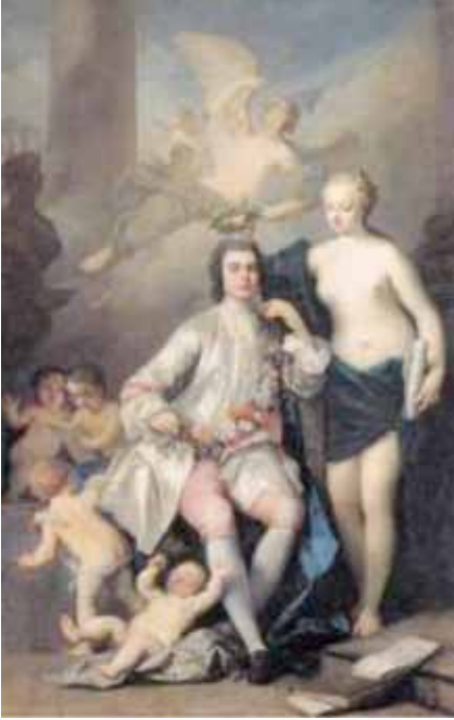
18. yüzyılın süperstar ses sanatçısı kastrat Farinelli'ydi (Carlo Broschi). Tabloda ilham perisi Euterpe, Farinelli'nin başına defne yapraklarından taç yerleştirirken. [Farinelli Crowned by Euterpe and Attended by Fame, Jacopo Amigoni, 1735].

Zamanında her biri birer yıldız olan operatik kastratlar arasında evrensel süperstar statüsü kazanmış olan kastrat, sahne ismi Farinelli olan, Carlo Broschi'ydi (1705-1782). Kastratların çoğu fakir aile çocuklarıydı ama Farinelli'nin babası valiydi; yani kendisi bir istisna olarak zengin bir aileden geliyordu. Farinelli, içinde yaşadığı yüzyılın en ünlü opera sanatçısı olduğu gibi gelmiş geçmiş en büyük şarkıcı olarak kabul ediliyor. Farinelli'nin ünü kastrat sanatçıların ve onlar için yaratılmış olan "opera seria" tarzının yok olmasından sonra bile devam etti.