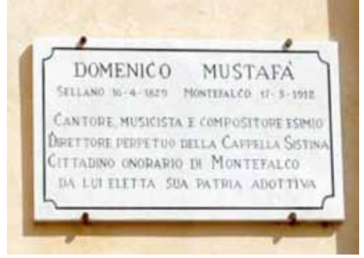
Domenico Mustafa'nın son yıllarını geçirdiği Montefalco'da adını taşıyan meydanın plaketi.

Hayatının son yıllarında bu çok özel insan ile görüşüp arkadaşlık etme şansına kavuşan Montefalcolu hemşerileri üstadın klasik müzik bilgisine ve ses kontrol yeteneğine hayran kaldılar. Hoş sohbet olan üstadın olağanüstü yaşamının çok ilginç detaylarını öğrendiler, unutulmaz anılarını, içinde yoğrulduğu müzik dünyasından ve Vatikan'dan aktardığı anekdotları dinlediler.