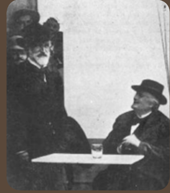
Giuseppe Verdi ve Domenico Mustafa alıcıları ile iynbir olan Montecatini'de.

Mustafa ve Sistine Şapeli Korosu 1893'te Chicago şehrinde yapılan Dünya Fuarında sahnede yer almak üzere Amerika'ya davet edildiler ama bu ziyaretin gerçekleştirilmesi çeşitli nedenlerle mümkün olmadı.