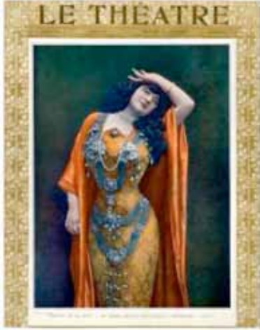
Emma Calvé, Jules Massenet’in “Hérodiade” operasında Salome rolünde. Le Theatre dergisinin kapağı, 1903.