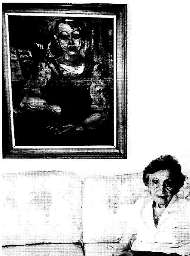
Illustration n° 2