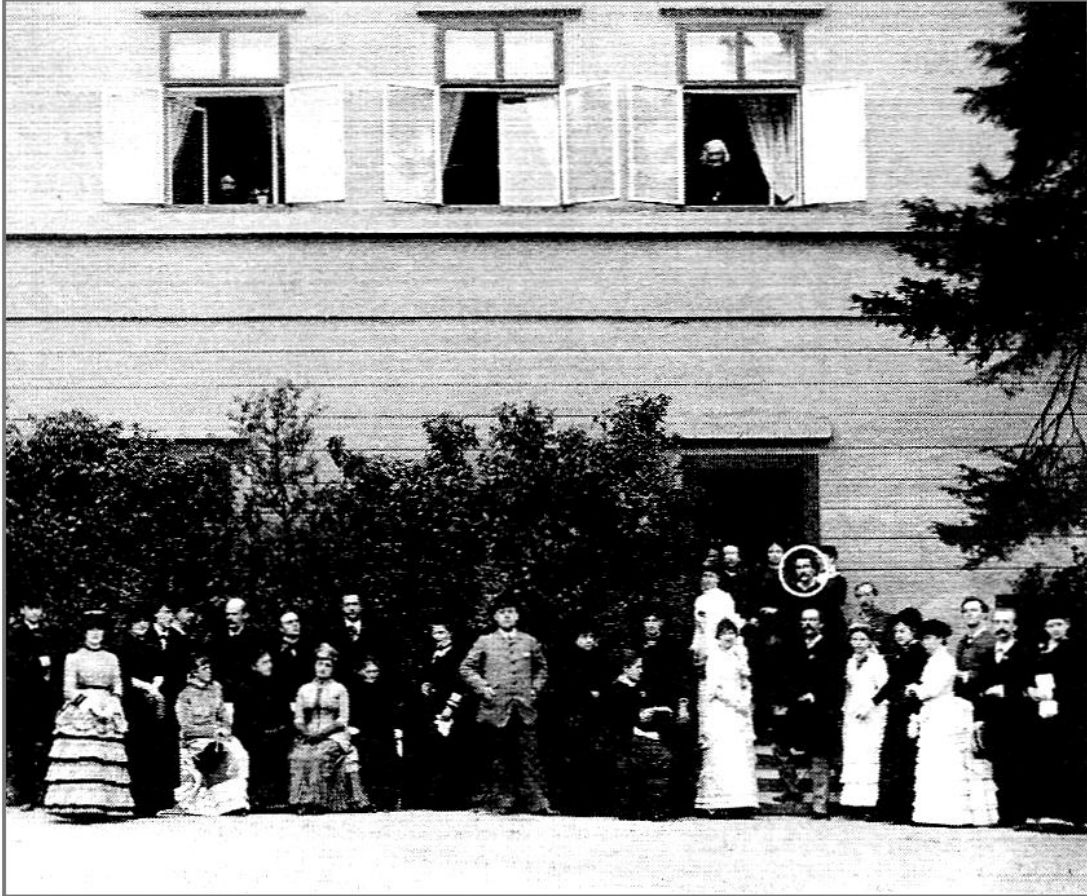
Illustration n° 1