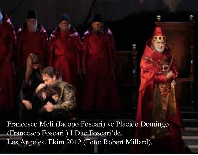
Francesco Meli (Jacopo Foscari) ve Plácido Domingo (Francesco Foscari) I Due Foscari'de. Los Angeles, Ekim 2012.