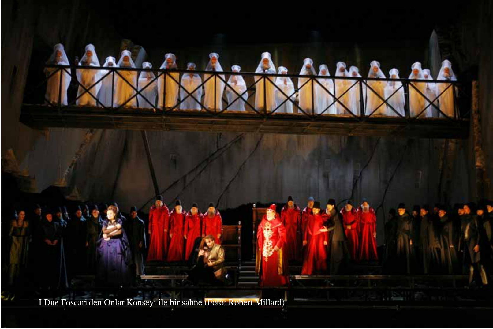
I Due Foscari'den Onlar Konseyi ile bir sahne.