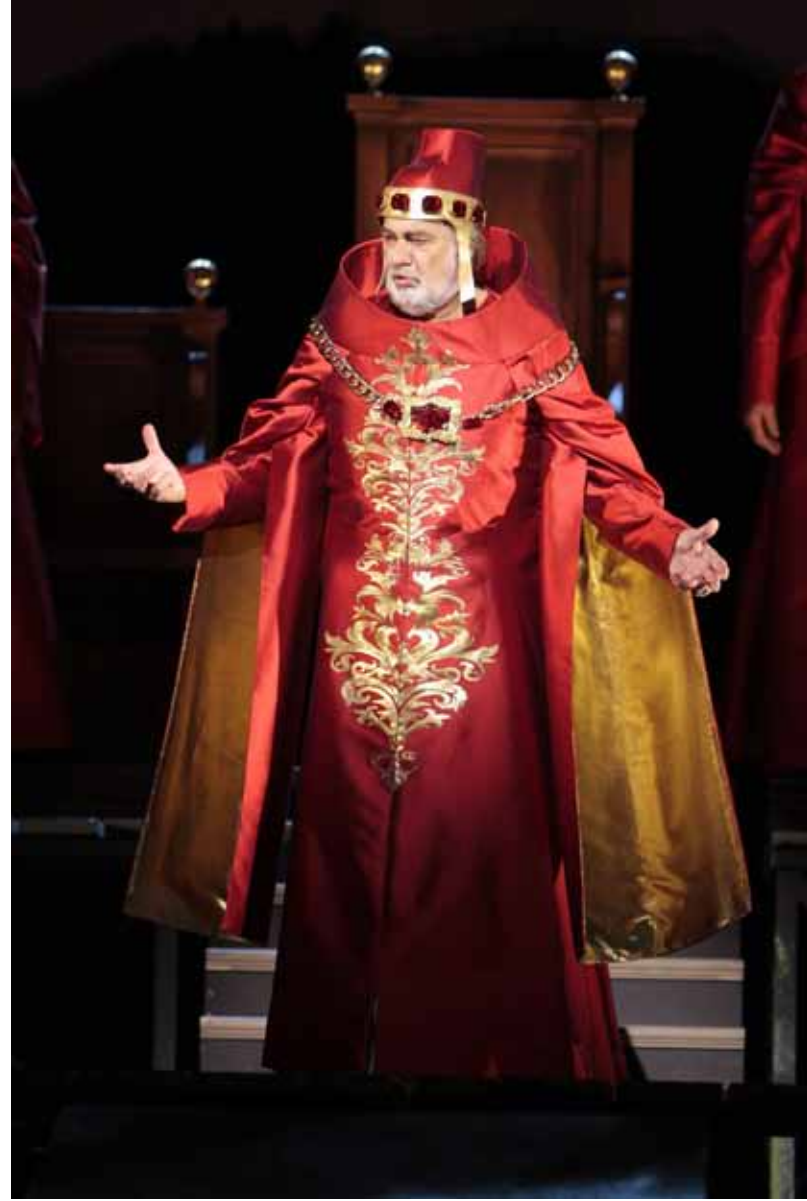
Los Angeles Opera'nın 2012-13 sezonunu açan Verdi'nin I Due Foscari (İki Foscari) operasında Plácido Domingo 15. yüzyıl Venedik Dükü Francesco Foscari rolünde. Los Angeles, Ekim 2012.

I Due Foscari elbette ki Verdi'nin en bilinen ve sevilen operaları arasında yer almıyor. Çok sayıda başeser bestelemiş bir bestecinin operaları arasında hepsinin aynı konumda olmasını beklemek de anlamsız olurdu zaten. Prömiyerinin üzerinden birkaç sene geçtikten sonra Verdi'nin kendisi bile operayı kişisel standartlarına göre biraz dekdüze bularak bir mektubunda; “baştan sona değişmeyen bir renk hakim” diyordu. Ama bunun yanısıra büyük opera ustası Gaetano Donizetti'nin I Due Foscari 'yi izledikten sonraki değerlendirmesi, “bu operayı ancak Verdi gibi bir dahi müzisyenin yazmış olabileceği” şeklindeydi.