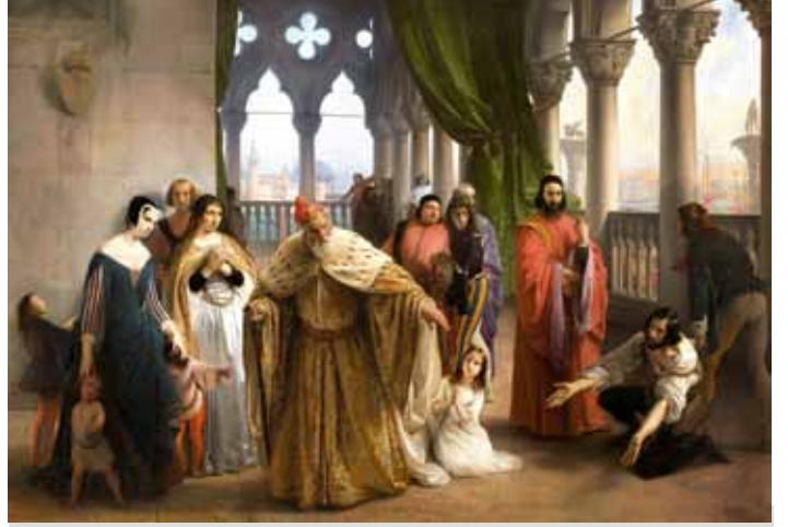
Jacopo Foscari'nin sürgüne gönderilmeden önce ailesi ile son görüşmesini gösteren bir tablo. Tablonun kompozisyonundaki canlılık, gerilim ve hareket dikkati çekiyor. [Ressam Francesco Hayez (1791-1882), 1840, Gallerie d'Italia - Piazza Scala, Milano].

Operanın librettosunda mekân olarak Venedik'i kullanmaya devam etmekle beraber, projenin Roma'da sahnelenmek üzere yazılması daha uygun olacaktı.