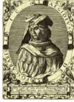
Venedik Dükü Francesco Foscari'nin portresi. (Graviür, New York Halk Kütüphanesi resim koleksiyonu).