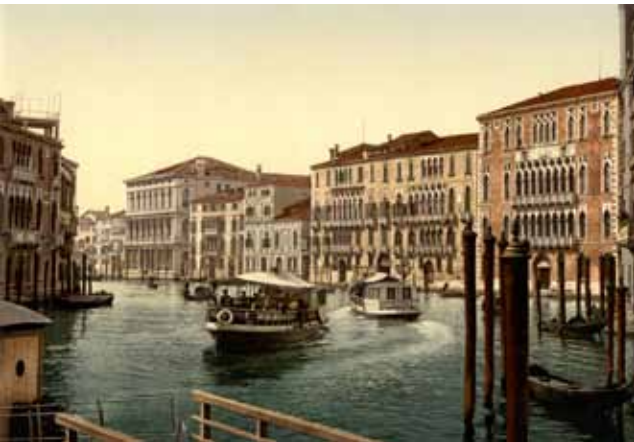
19. yüzyılın sonunda Venedik'te Foscari sarayının görünüşü. (en sağdaki yapı)

Foscariler'in başına gelenler ve sonunda düşmanları Loredano'nun muzaffer olması hangi ailenin haklı olduğunu kesin olarak belirlemiyor. Jacopo gittikçe daha güçlenen Onlar Konsülü'nün kurbanı mıydı, yoksa Konsül kendisine sadece sürgün cezası vererek Dükün oğlunun aslında çok daha ciddi olan suçlarını görmezlikten mi geldi?