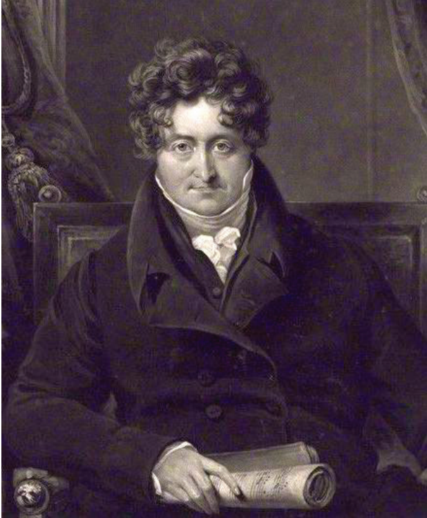
İrlandalı tenor, besteci ve şarap tüccarı Michael O'Kelly (1762-1826).

Operayı Londra'da ve başka yerlerde de izledim ama Hakim'in kekeme olarak oynandığını görmedim. Hatta bu sahne bazen tamamen atlanıyordu. Ben bu karakteri ahmak bir yaşlı adam şeklinde canlandırdım, ama gerçekte o zamanlar daha çiçeği burnunda bir gençtim. Operanın sonunda izleyicilerin alkışlarının bitmeyeceğini düşündüm. Israrla Mozart'ı sahneye çağırıyorlardı. Eserin her parçası istek üzerine tekrarlandı, öyle ki bir değil iki opera