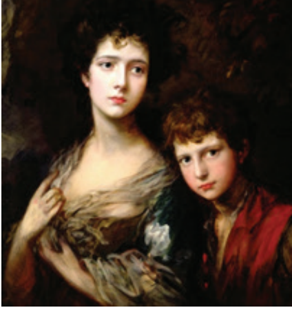
Solda Kelly'nin sözünü ettiği İrlandalı ozan ve oyun yazarı Richard Brinsley Sheridan'ın (1751-1816) eşi Elizabeth Linley. Sağda Elizabeth'in erkek kardeşi Thomas Linley (1756-1778) 12 yaşında (Thomas Gainsborough, 1768).