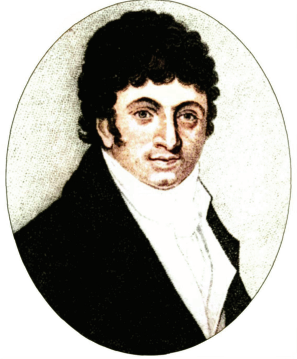
Micheal O'Kelly gençliğinde

İtalya'da ilk sahneye çıkışı 1781 yılında komik tenor rolünde Lucca Operası'nda oldu. Buradan Floransa'ya gitti. Ardından Venedik dahil olmak üzere Graz, Verona, Modena ve Parma gibi şehirlerde çalıştı. 1783'te İmparator II. Josef'in Venedik Büyükelçisi'nin tavsiyesiyle ve arkadaşları Storace Kardeşlerin teşvikiyle Viyana'ya giderek yeni kurulan İtalyan Opera topluluğuna katıldı. Kelly, Viyana'da geçirdiği dört yıl boyunca, aralarında Nancy Storace, Francesco Benucci ve Stefano Mandini'nin de bulunduğu günün en iyi opera sanatçılarıyla, genellikle komik tenor rollerinde sahneyi paylaştı.