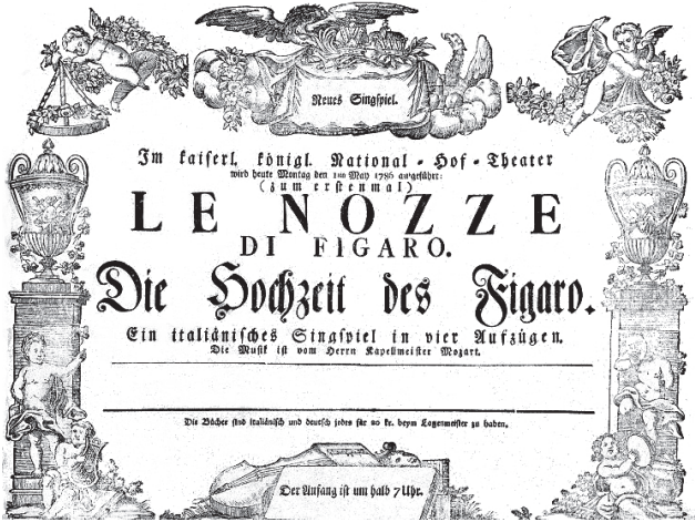
Mozart'ın ünlü operası Figaro'nun Düğünü'nün 1 Mayıs 1786 tarihinde Viyana Burgtheater'de yapılan prömiyerinin afişi.

Figaro'nun Düğünü'nün Viyana prömiyerinde, 24 yaşındaki Kelly hem Don Basilio hem de Don Curzio rollerini seslendirdi.