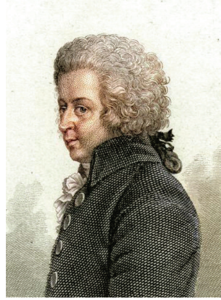
Wolfgang Amadeus Mozart (1756-1791).

Bu Alman yolculuğunun bütün detaylarını anlatsaydım yazmayı hiç bitiremezdim. Bu nedenle durduğumuz değişik yerlerden bahsetmekle yetineceğim. Gözlemlmeye değer yerlerden ilki, başka hiçbir özelliği olmasa bile 1756 yılında orada hayata gelen Mozart'ın doğum yeri olarak kutlanması gereken Salzburg'du. Yüksek kulelerini uzaktan huşu içinde izledim. Vardığımızın ertesi günü bir saray görevlisinin eşliğiyle Mozart'ın babasını ziyaret ederek oğlunun mektubunu kendisine teslim ettim."