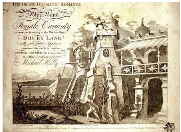
Bestesini Michael Kelly'nin yaptığı ve 1798'de Londra Drury Lane'de baş rolde oynadığı, Türkiye'de geçen orientalist opera Bluebeard; or, Female Curiosity 'nin afişi.

Kelly aynı zamanda şarap ticaretiyle de uğraştı. Sanatçının bestecilik çalışmaları ile alay eden ozan Richard Sheridan, dükkânın tabelası "Şarap bestecisi ve müzik ithalatçısı Michael Kelly, dese daha yerinde olurdu," diyerek Kelly'nin besteciliği ile alay ediyordu.