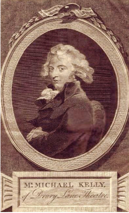
Michael O'Kelly 1787'de İngiltere'ye döndükten sonra Drury Lane'de çalıştı. (Gravür: James Neagle, Sir Thomas Lawrence'ın orijinali üzerine, 1796.)