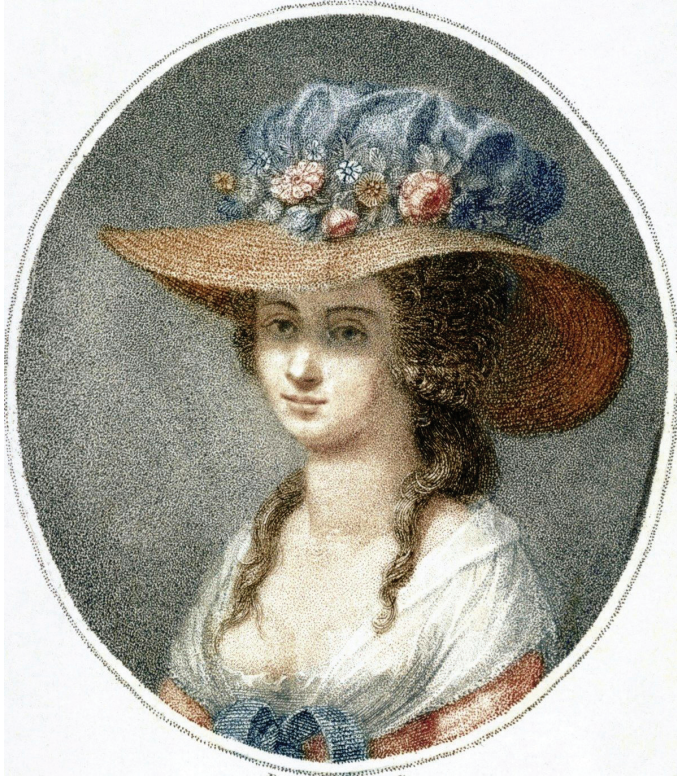
Mozart'ın Susanna'sı, İngiliz soprano Nancy (Anna) Storace (1765-1817).

Nancy ve kardeşi Stephen, Kelly ve Attwood'la beraber Mozart'ın yakın arkadaşları arasında yer aldılar. Sık sık evinde bir araya geliyorlardı. Yetenekli bir besteci olan Stephen Storace bir süre Mozart'ın öğrencisi oldu.