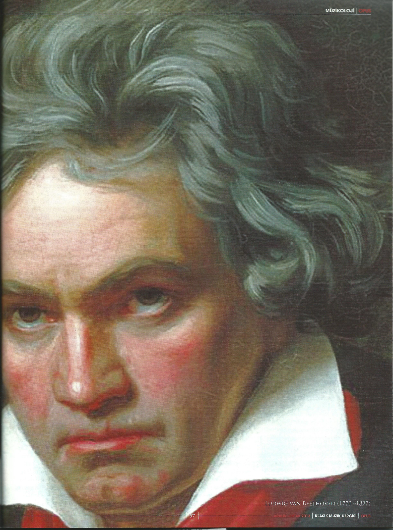
LUDWIG VAN BEETHOVEN (1770 –1827)