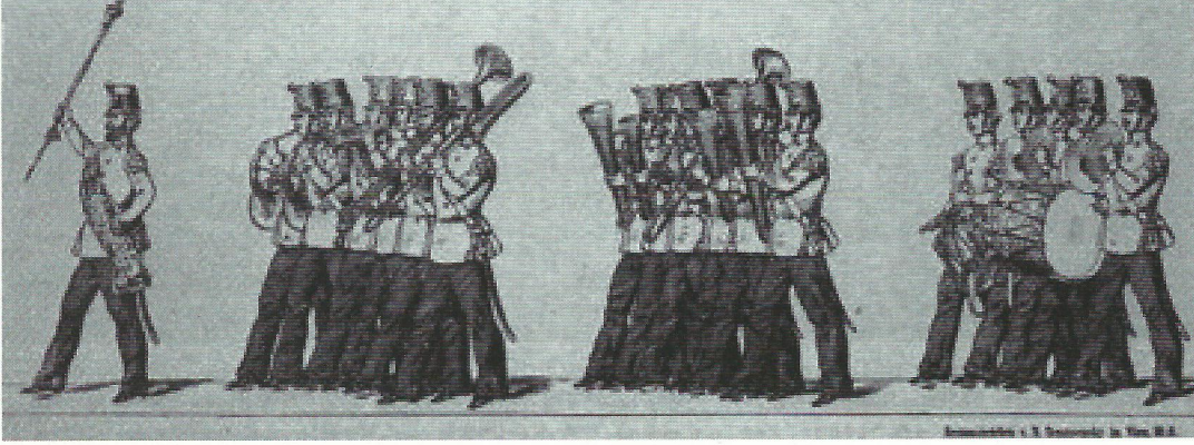
1830 yılları Viyana'sında bir Avusturya askeri bandosu. Litograf: Michael Trepsensky.

kışlaya ve koğuşlarına dönmesi için bir ikaz mahiyetindeydi. Daha sonraları bu terim askeri bandoların gösterileri ve resmi geçit törenleri için bestelenen müzik için kullanılmaya başlandı. Almanca'da "Tattoo" nun karşılığı "Zapfenstreich". Bu kelime zamanla ilk koğuş borusundan sonra sadece trompet ve davulların değil de bütün alay