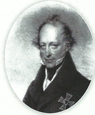
Beethoven'in WoO 18 ve WoO 19 Tattoo'ları ithaf ettiği Avusturya Arşidükü Anton Viktor [1779-1835]. Litograf Josef Kriehuber, 1834.