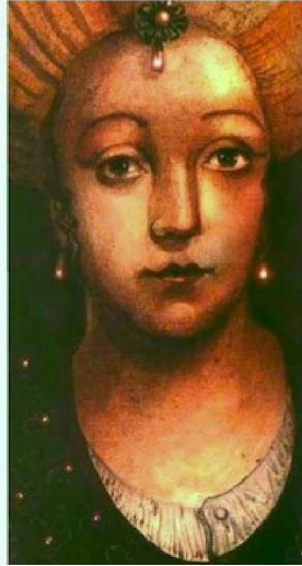
Hürrem, Mihrimah ve Kösem Sultanlar.

Beaussant La Sultana üzerine ayrıca şu bilgiyi veriyor: