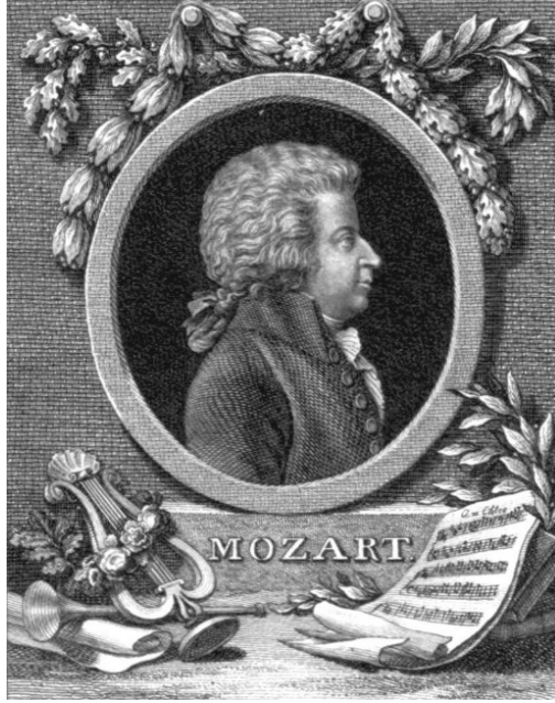
Wolfgang Amadeus Mozart (1756–1791)