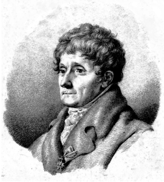
Antonio Salieri (1750-1825). Michael Kelly'ye Viyana'da La Scuola dei Gelosi operasında ilk rolünü teklif eden besteci.

Kelly Viyana'ya geldiğinde Krallık operasının yardımcı yönetmeni Antonio Salieri ona İtalyan Opera topluluğunun sahneye koyacağı La Scuola dei Gelosi operasında bir rol teklif etti. Bu operada Nancy Storace da Viyana'da müzikseverlerin karşısına çıkacaktı. Kelly sahneyi Nancy Storace ile paylaştığı bu ilk rolünde büyük başarı kazandı.