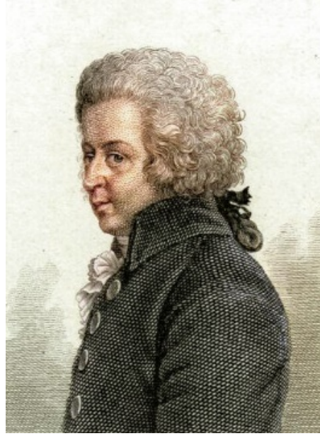
Wolfgang Amadeus Mozart (1756-1791).

görevlisinin eşliđiyle Mozart'ın babasını ziyaret ederek ođlunun mektubunu kendisine teslim ettim.”