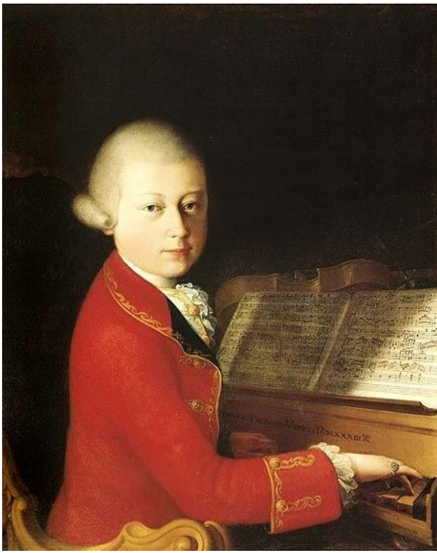
14 yaşındaki Mozart Verona'da (Yağlıboya: Giambettino Cignaroli ve Saverio dalla Rosa, 1770).