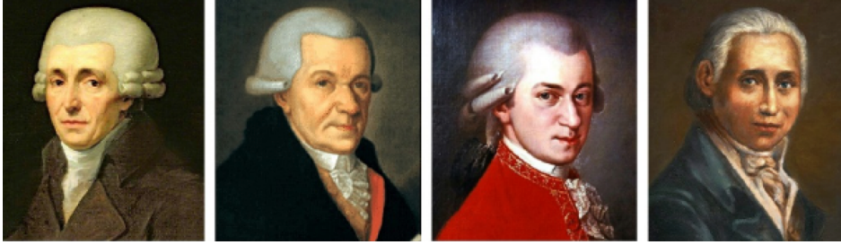
Kelly'e göre 1784 yılında Viyana'da Stephen Storace'ın evinde çalan kuartet üyeleri: Josef Haydn (1. keman), Carl Ditters von Dittersdorf (2. keman), Wolfgang Amadeus Mozart (viyola), Johan Baptist Vanhal (viyolonsel).

Keşke Kelly bu topluluğun ne çaldığı üzerine biraz bilgi verseydi. Yazdığı bir iki cümle ile konserin dinamiğini ve detaylarını tamamen bizim hayal gücümüze bırakmış oluyor.