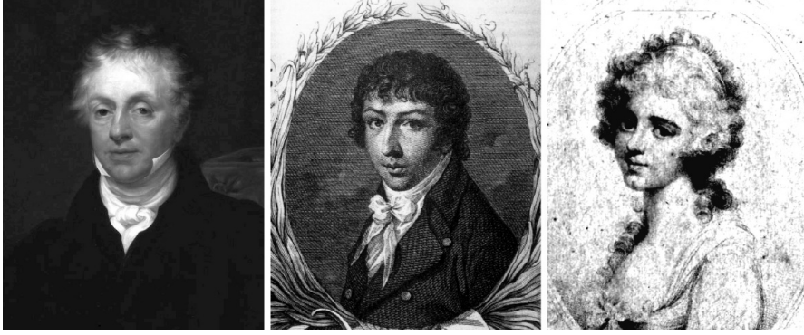
Michael Kelly’nin Viyana’da geçirdiği yıllardan arkadaşları: Solda ve ortada Mozart’ın öğrencileri Thomas Attwood (1765-1838) ve Stephen Storace (1762-1796); sağda Stephen’in kız kardeşi ve “ Figaro’nun Düğünü ”ndeki ilk Susanna, soprano Nancy Storace (1765-1817).

“Arkadaşım Attwood (müzik dünyasının gurur kaynağı değerli insan) Mozart’ın en sevdiği öğrenciydi. Mozart’ın onun hakkında söylediklerini size aktarmak benim için bir zevk. Şöyle dedi: ‘Attwood sevdiğim ve değer verdiğim bir genç. Dürüst ve görgü sahibi. Şunu söyleyeyim ki benim stilimden en çok faydalanan öğrencim. Tahmin ediyorum ki ileride gayet başarılı bir müzisyen olacak.’ Mozart yetenekli öğrencilere hoş sözlerle cesaret vermekten geri kalmazdı ama küstahlığa ve sıradanlığa tahammülü yoktu.”