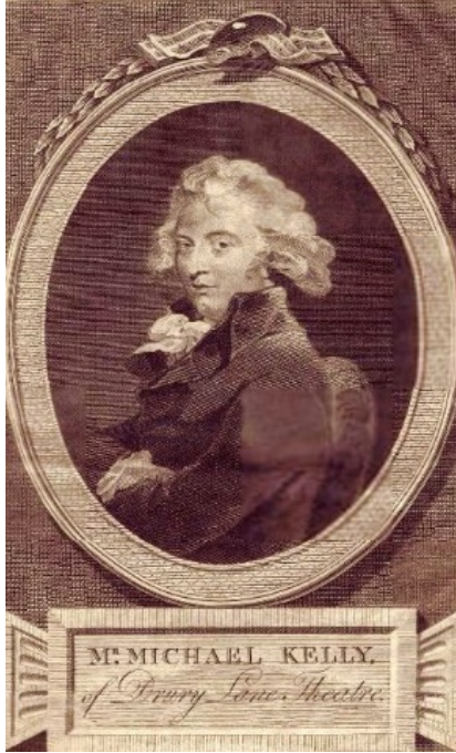
Michael O'Kelly 1787'de İngiltere'ye döndükten sonra Drury Lane'de çalıştı

Anıları Kelly'nin ölümünden kısa süre önce 1826'da, sanatçının günlüğünü ve notlarını kullanarak Theodore Hook adlı bir maceracı tarafından derlenerek yayımlandı. Canlı bir üslupla kaleme alınan bu anılar melodramatik, coşkulu ve neşeli bir yazımla iki cilt boyunca devam ediyor. Napoli'deki hayatı, İtalya turnelerini, başına gelen ilginç olayları, zamanın müzisyenlerinden ve operalarından anekdotlar aracılığı ile Avrupa'nın kültürel yaşamını eğlenceli bir şekilde belgeliyor.