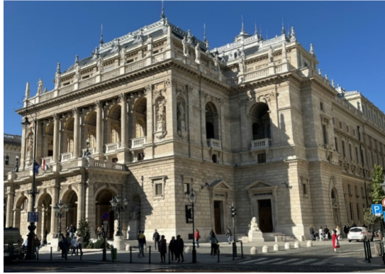
Budapeşte'deki Macaristan Devlet Operasının Andrassy bulvarına bakan ön cephesi (Foto: Ömer Eğecioğlu, 19 Ekim 2024).

Macaristan Devlet Operası (Magyar Állami Operaház) 2024-25 programına Verdi'nin Otello 'sunu da dahil etti. 2024 yılı Macar-Türk Kültür Yılı etkinlikleri Budapeşte'de son hızla devam ederken, 19 Ekim 2024 akşamı muhteşem akustiğe sahip bin kişilik Macaristan Devlet Operası salonunda Otello 'yu izleme fırsatı buldum. Opera orkestrasını Fransız şef Frédéric Chaslin yönetti.