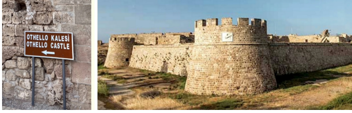
Kıbrıs Gazimağusa'daki Othello kalesi. Kalenin hemen önündeki küçük parkta ise Othello'nun yazarı William Shakespeare'in bir büstü bulunuyor.

IV. Perde: Desdemona, Otello'nun niyetlerinden habersiz yatmağa hazırlanmaktadır. Otello içeri girer ve bir anlık sevgi gösterisinin ardından, sadakatsiz olduğuna inandığı Desdemona'yı boğar. Emilia geldiğinde Desdemona'nın ölmekte olduğunu görür. Desdemona kendini savunur ve Emilia, Otello'ya Iago tarafından aldatıldığını anlatır. Otello, Desdemona'nın bedenini kucakladıktan sonra kendini öldürür.