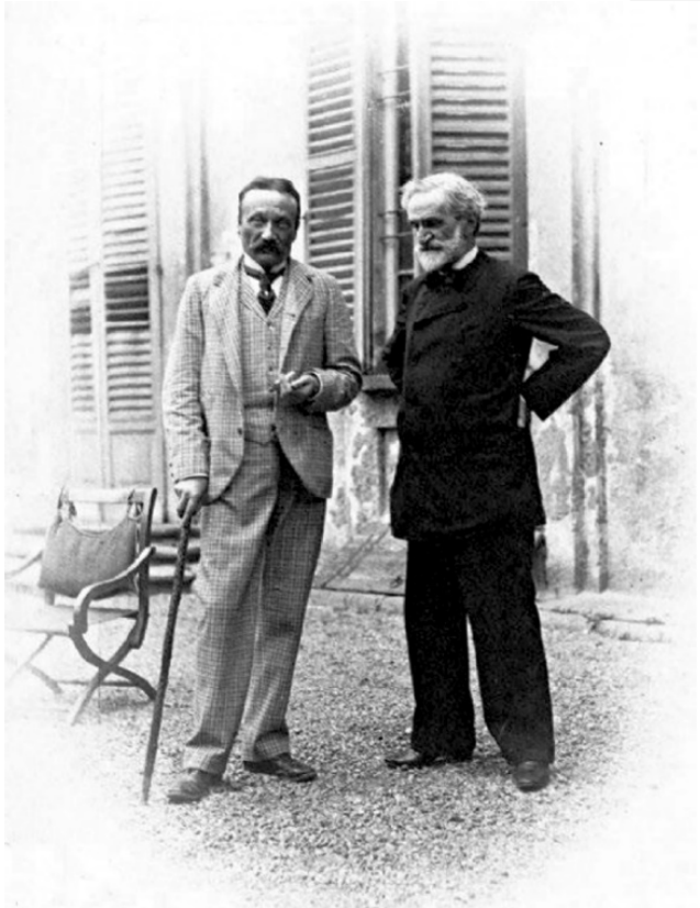
Arrigo Boito ve Giuseppe Verdi, 1892 yılında müzik yayıncısı Giulio Ricordi'nin Milano Via Borgonuovo'daki evinin bahçesinde.

Prömiyeri 1871 sonunda yapılan Aida 'nın başarısından sonra daha altmışına varmadan çiftliğine çekilip emekli hayatı yaşamaya başlayan Giuseppe Verdi , kronolojik olarak Aida 'nın ardından gelen operasını uzun seneler sonra besteledi. 1847'de Macbeth 'i operalaştırmış olan Shakespeare hayranı besteci, müzik yayıncısı Giulio Ricordi 'nin bitmez tükenmez ısrarları sonucu Otello üzerine çalışmaya başladı. Verdi'nin son operası (ve tek komedisi) Falstaff 'tan hemen önce bestelediği bu yeni opera, besteciye dramatik gücünün zirvesine çıkardı ve Otello kısa zamanda dünya opera repertuarının önde gelen yapıtları arasında yerini buldu. Eser New York'ta 1888'de, Londra ve bazı kaynaklara göre İstanbul'da 1889'da, ve Cumhuriyet Türkiye'sinde 12 Mart 1960 tarihinde Ankara Devlet Operası tarafından Ankara'da ilk kez seslendirildi.