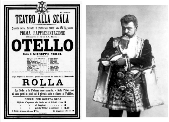
Otello'nun La Scala'daki 5 Şubat 1887 tarihli prömiyerinin afişi ve ilk Otello Francesco Tamagno (1850-1905).

Opera, William Shakespeare'in Othello adlı trajedisinden Verdi'nin arkadaşı ve librettisti, besteci Arrigo Boito tarafından uyarlanarak hazırlandı. Othello oyununun da ilginç bir tarihi var. Shakespeare'in trajedisi için kaynak olarak kullandığı Un Capitano Moro (Mağribi Bir Komutan) öyküsü, 1565 yılında Giovanni Battista Giraldi adlı İtalyan yazar tarafından kaleme alınmıştı. "Disdemona" hariç bütün karakterlerin isimsiz olduğu orijinal hikâyedeki Mağribi (The Moor) karakteri için "Othello" adını uygun görüp kullanan Shakespeare oldu. Boito'nun librettosunda baş karakterin ve operanın adı İtalyanca şekli ile "Otello" olarak değişti. Boito, Shakespeare'in oyununu bir operanın gerektirdiği yoğun biçime uydurmak üzere kısaltmalar yaptı ve olayların akışında da bazı değişiklikler önerdi. Boito'nun librettosu 1879 yılında hazırıldı. Verdi'nin bu projeye başlaması ise birkaç yıl daha alacaktı.