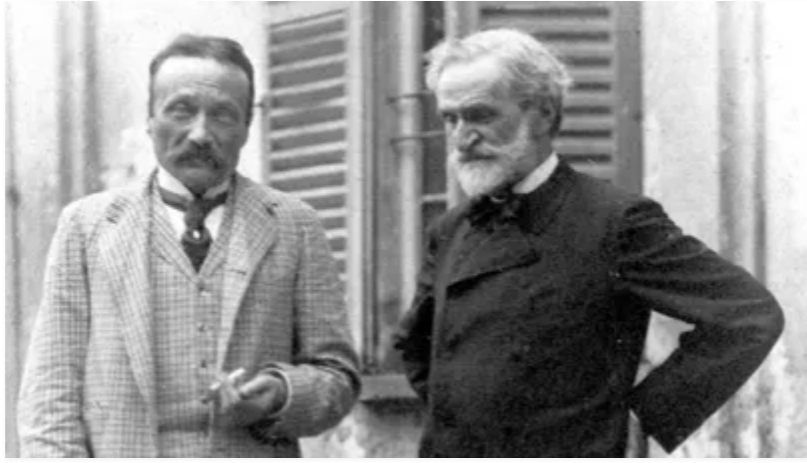
Falstaff 'ın librettisti Arrigo Boito, Giuseppe Verdi ile.

Verdi, 1887'de Otello 'nun başarısından sonra ileri yaşı nedeniyle yeni bir eser yazma konusunda tereddüt ederek doğduğu yer olan Busseto'daki çiftliğine çekildi. Ancak arkadaşı ve librettisti Arrigo Boito'nun ısrarıyla yeniden çalışmaya başlayarak Shakespeare'in komedisi Windsor'un Şen Kadınları 'nı esas alan Falstaff operasına odaklandı.