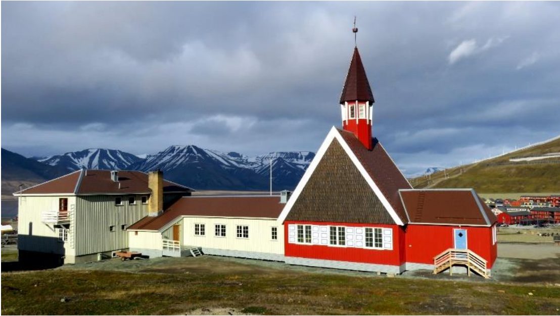
Longyearbyen'deki Svalbard Kilisesi (Foto: Ömer Eğecioğlu).

Bölgedeki önemli müzik mekanlarından biri de Svalbard Kilisesi 'dir. Askeri olmayan ibadet yerleri arasında konumu dünyanın en kuzeyinde olan bu kilise yalnızca dini törenler için değil, Noel ve yeni yıl konserleri, koro etkinlikleri ve klasik repertuvar programları için de kullanılır. Akustığı özellikle vokal müzik ve oda müziği için uygundur. Zaten yerel korolar Svalbard'ın müzik yaşamında önemli bir rol oynar.