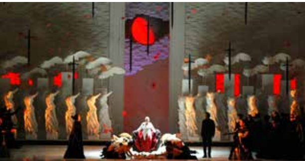
São Paulo Belediye Kültür Sarayı'nda 2015 yılında sahnelenen Jules Massenet'in "Thaïs" operasından bir sahne.