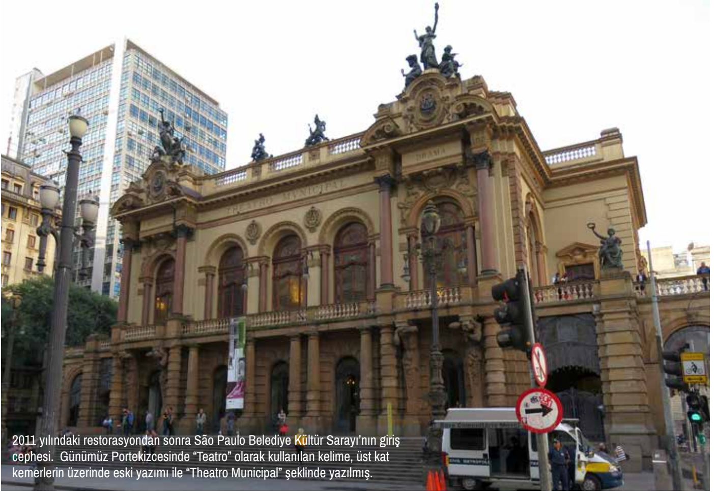
2011 yılındaki restorasyondan sonra São Paulo Belediye Kültür Sarayı'nın giriş cephesi. Günümüz Portekizcesinde "Teatro" olarak kullanılan kelime, üst kat kemerlerin üzerinde eski yazımı ile "Theatro Municipal" şeklinde yazılmış.