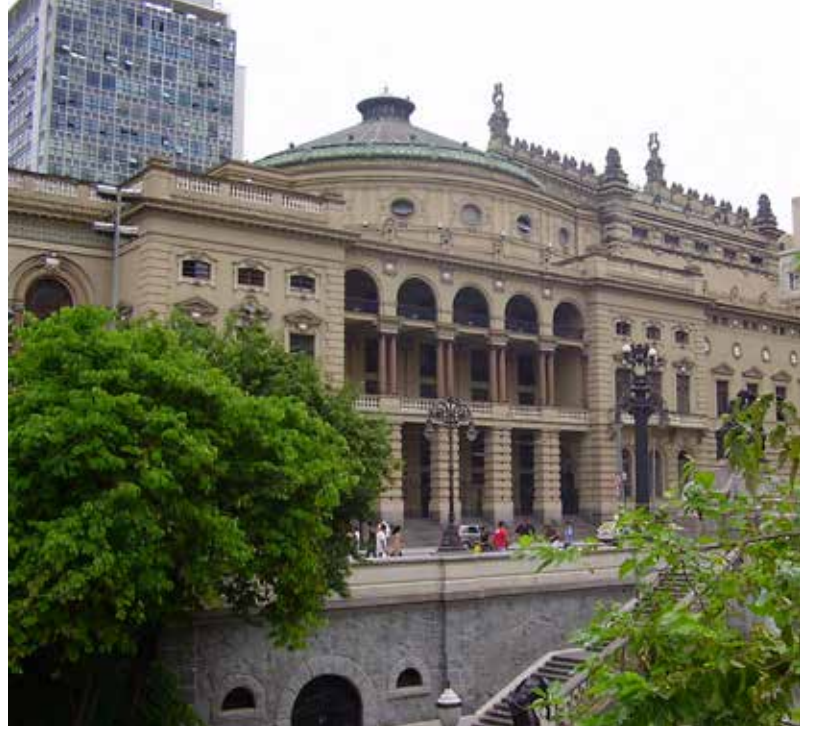
São Paulo Kültür Sarayı'nın Anhangabaú Parkı'na bakan yan cephesi.

Foyerde İtalyan mermeri merdivenlerin iki yanını süsleyen Floransa'dan getirilmiş olan heykellerden biri. Sağ tarafta Sarayın restoran ve kafesinin vitrayları görünüyör.