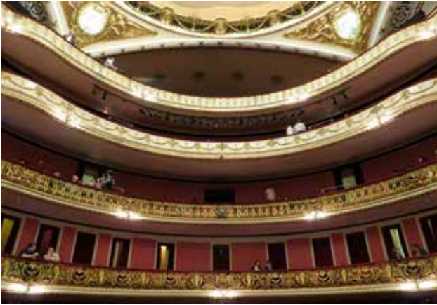
São Paulo Belediye Kültür Sarayı'nın sahneden balkonlara doğru bakış.