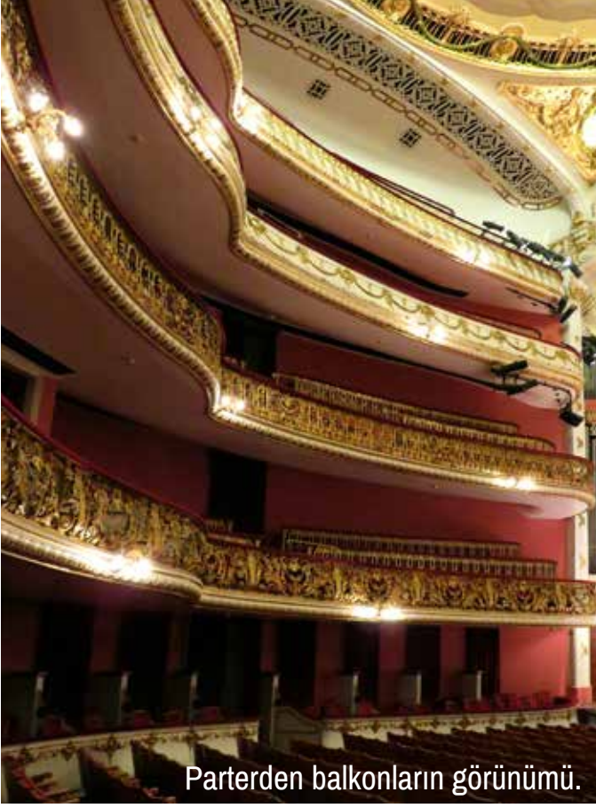
Parterden balkonların görünümü.

“Aynalı Salon” adı verilen yan salondaki çiçek motifli vitraylar Fransız tarzında iki taraflı açılan devasa kapıların camlarını süslüyor. Bu Murano yapımı parlak renkli ve çekici vitraylar hakkında yazılmış bir kitap bile bulunuyor. Aynı cins vitraylar fuayenin hemen yanında yer alan restoran ve kafenin kapılarını da süslüyor.