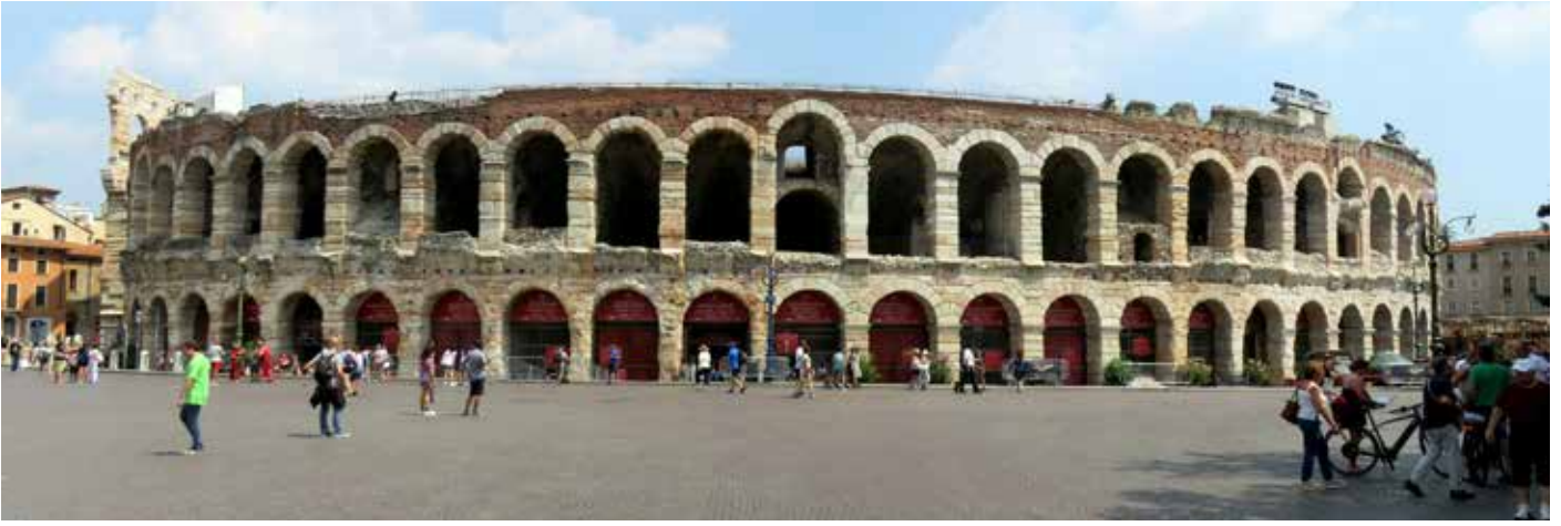
Arena di Verona'nın Bra meydanından görünümü. Temmuz 2018.