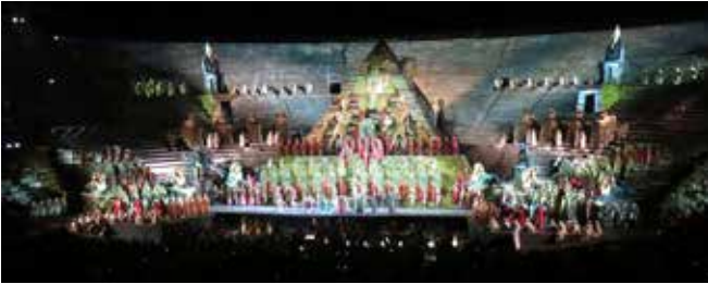
Franco Zeffirelli'nin yönetmenliğini ve dekoratörlüğünü yaptığı Aida operasının 2. perdesinden bir sahne. Verona Arena, 14 Temmuz 2018.

AKOB okuyucuları hatırlayabilirler; 2012 Mayıs tarihli AKOB dergisinin 13. sayısında La Scala'da izlemek şansına kavuştuğum bu Aida prodüksiyonu hakkında " Zeffirelli'nin Aida'sı 49 Yıl Sonra La Scala'da " başlıklı bir yazı yazmıştım.