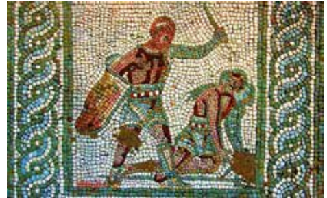
Roma İmparatorluğu'nun renkli halk eğencesi gladyatör dövüşlerinin mozaik bir betimlemesi.

Roma imparatorluğunda amfityatroların ilk sergilediği gösteriler gladyatör dövüşü değil de devasa imparatorluğun dört bir tarafından getirilen vahşi hayvanların karşı karşıya gelmesiydi: filler, aslanlar, panterler, ayılar, timsahlar, gergedanlar bu egzotik hayvanlar arasında yer alıyordu. Hem birbirleriyle savaşıyorlardı, hem de arenada seyirciler önünde avlanıyorlardı.