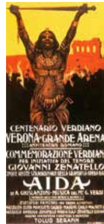
1913 yılında Verona Arena'da gösterilen ilk Aida'nın afişi.