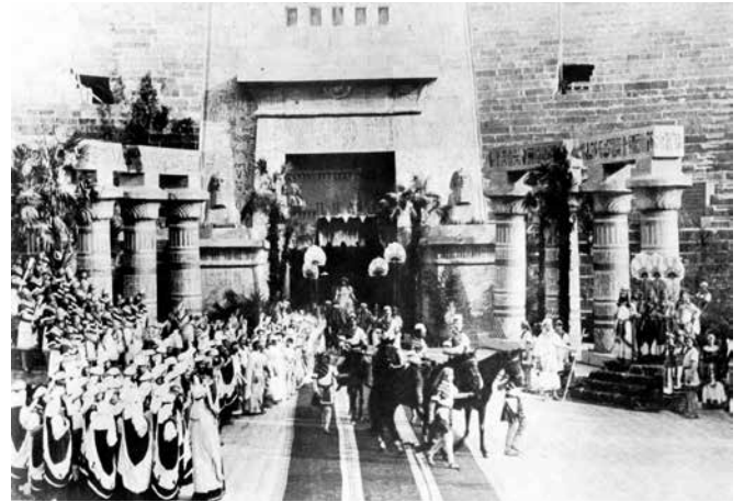
Verona Arena'nın 1913'te Aida operası ile açıldığı ilk günün gösteriminde, operanın ünlü "Zafer" geçit resminden bir sahne (Kaynak: E. Paganuzzi, C. Bologna, L. Rognini, G. M. Cambie, M. Conati, La Musica A Verona, 1976, Verona).

Tabii ki bu arenada izlenen operalar eşi bulunmaz bir anı niteliğinde, özellikle operayı çok seviyorsanız. Mekân açık olduğu için kötü hava koşullarından etkileniyor ama yaz yağmuru riskini göze almış ve buraya gelme şansını kazanmış opera tutkunları için bu elbette büyük bir külfet sayılmaz.