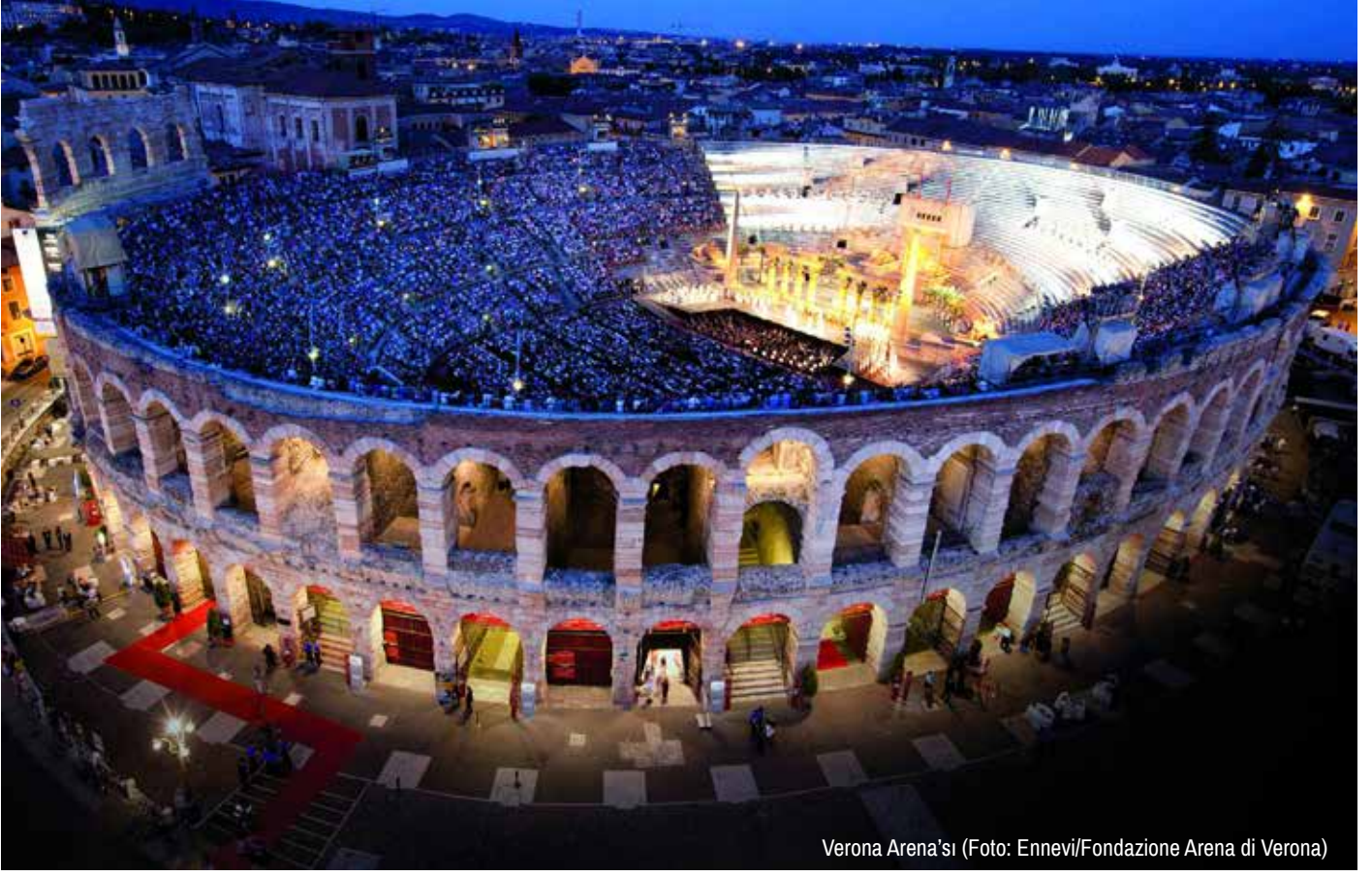
Verona Arena'sı