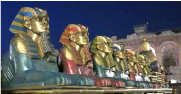
Aida gösteriminden bir gece önce Bra meydanında sahneye taşınmayı bekleyen dekorlar. Verona, 13 Temmuz 2018.