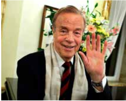
2018 yılında 95 yaşına basan ünlü İtalyan yönetmen Franco Zeffirelli.

2018 festivalinde hem Turandot hem de Aida , İtalya'nın en ünlü yönetmenlerinden opera ve sinema ustası Franco Zeffirelli'nin yapımları. Zeffirelli'nin yönettiği ve dekorlarını da yaptığı gözalıcı Aida , bundan önce Verona Arena'da 2002-2006, 2010, 2015 yıllarının festivallerinde de yer almıştı.