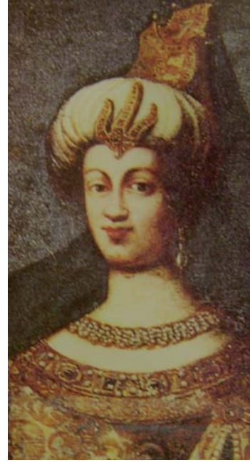
Hürrem, Mihrimah ve Kösem sultanlar.

veriyorlar. 9 Diğer uzmanlara göre ise bu tarih 1695. Eserin bestelenme tarihi kesinlikle bilinmemekle beraber uzmanlar La Sultanne 'nin stil olarak ilk dört sonattan sonra yazıldığı noktasında hemfikir.