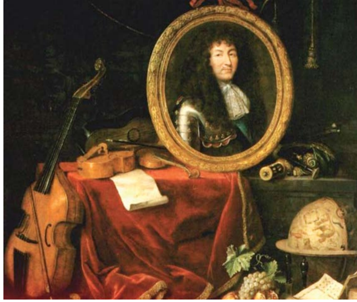
François Couperin'in patronu "Güneş Kral" XIV. Louis. Sanat ve kültüre gösterdiği ilgi ve desteği vurgulamak üzere etrafına dizili olarak resimlenen objelerin arasında solda zamanın popüler çalgısı viyola da gamba da var. 3

Couperin, Corelli ve Lully'ye olan saygısını nasıl bu iki yapıtla dile getirdiyse, iki yüz sene sonra Maurice Ravel de piyano için bestelediği Le tombeau de Couperin süiti ile