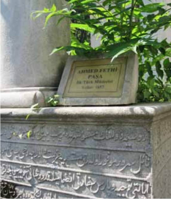
Fethi Ahmed Paşa'nın Sultan II. Mahmud'un Divanyolu'ndaki türbesinin bahçesinde bulunan kabri ve mezar taşı. Temmuz, 2010.

Paşa, kraliçenin huzuruna kabul edilmek üzere dün sabah [29 Ağustos 1838] maiyeti ile birlikte Regent's Park'taki Türk büyükelçiliği rezidansından Windsor kalesine doğru yola çıktı... Kraliçenin 29 Ağustos akşamı vereceği ziyafete katılacak olanlar arasında Fransa büyükelçisi Sébastiani ve eşi, Sârim Efendi, Türk büyükelçisi ekselânsları Fethi Ahmed Paşa ve Vikont Palmerston yer alıyor." (30 Ağustos 1838).