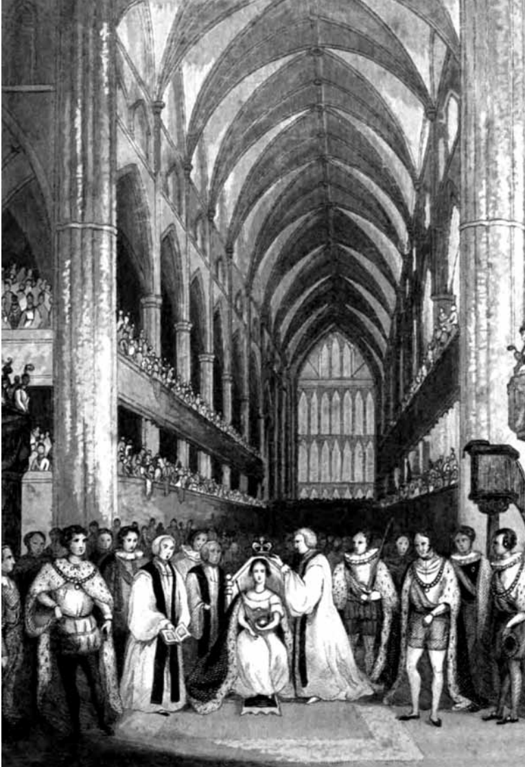
Kraliçe Victoria'nın Londra Westminster Abbey'deki taç giyme töreni, 28 Haziran 1838.

Fethi Ahmed Paşa Osmanlı tarihinde birçok ilke imza atmış bir devlet adamı. Karantina uygulamalarından çeşm-i bülbül yapımına, Dolmabahçe Sarayı'nın dekorasyonundan Haliç'te yolcu vapuru işletmeciliğine kadar birçok işe el atmış. Sultan II. Mahmud'un damadı, Sultan Abdülmecid'in kayınbiraderi ve arkadaşı olarak büyük nüfuz ve servet sahibi olmuş. Bu nedenle hem çok dost, hem de çok düşman edinmiş. Bu makalede Fethi Ahmed Paşa'nın Kraliçe Victoria'nın taç giyme töreninde bulunup bulunmadığı konusunu ele alacağız.