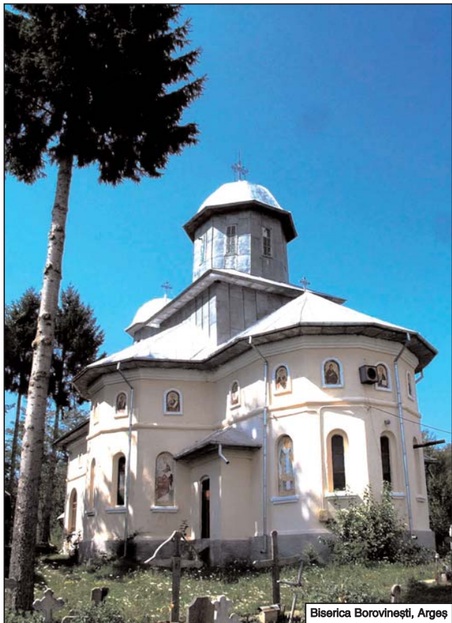
Biserica Borovinești, Argeș