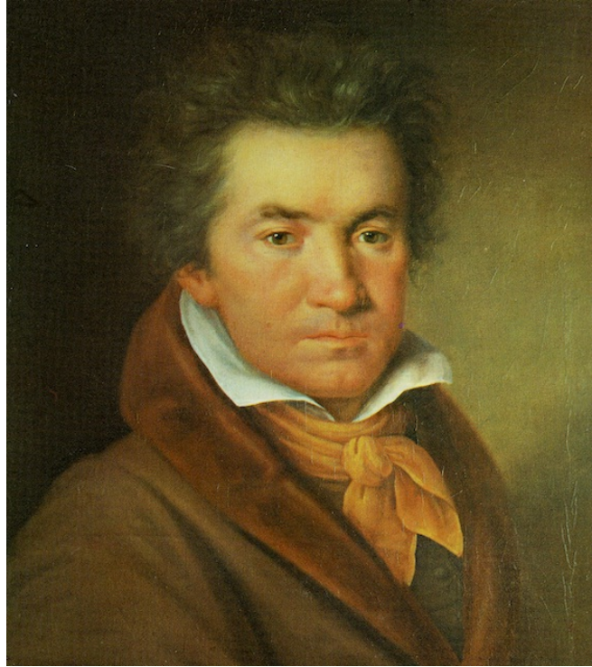
Ludwig van Beethoven (1770-1827).