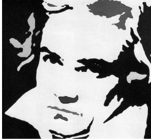
Ludwig van Beethoven.

Bir dünya savaşının ortasında söylenen bu sözlere ve Beethoven'ın dile getirdiği kardeşçe yaşama arzusuna günümüz dünyasının da yakından ve daha da dikkatle kulak vermesi en büyük dileğimiz.