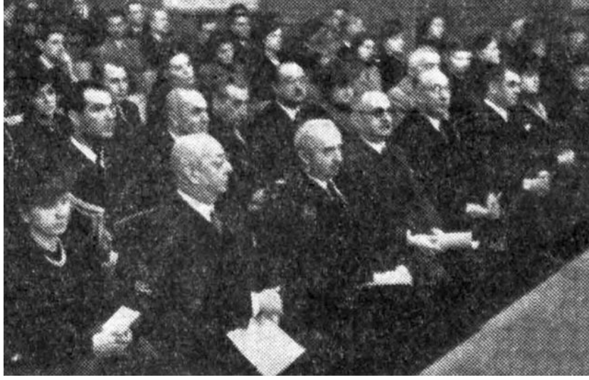
Cumhurbaşkanı İsmet İnönü ve erkânı 18 Nisan 1942 Cumartesi günü Ankara Devlet Konservatuvarı Salonunda Dokuzuncu Senfoninin prömiyerinde (Cumhuriyet gazetesi, 21 Nisan 1942).

ve İngiliz sefirleri ile Alman büyük elçisi Von Papan yine gazetenin birinci sayfasında veriliyor.