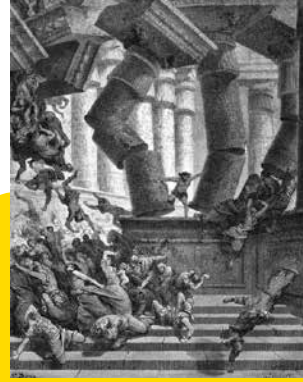
Samson ve Dalila operası, Samson'un Dagon tapınağını yıkması ile biter.

Birinci perde Samson'u Gazze'deki Yahudi isyanının kahramanı olarak tanıtmakta ve Dagon tapınağının rahibesi Filistinli güzel Dalila ile tanışmasını anlatmaktadır. İkinci perdede Dalila'nın Samson'u baştan çıkarması ve gücünün kaynağı olan saçlarını kestirerek ihaneti, üçüncü perde ise gücünü kaybetmiş ve kör olmuş Samson'un Filistinlilerin çılginca kutlamalarının ortasında kutsal Dagon tapınağını tepelerine yıkması üzerinedir.