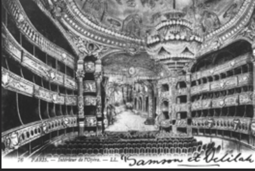
Arka planda Samson ve Dalila operasının dekoru ile Paris Opéra'nın içini gösteren bir gravür.

Alman mezo soprano Auguste von Müller'e (1848-1912) verildi. Prömiyerde Samson'u seslendiren Alman tenor Franz Ferenczy'di (1835-1881). Weimar'da büyük başarı kazanan eserin diğer şehirlerde gösterilmesi ve ardından uluslararası üne kavuşması ise ancak 1890'larda oldu.