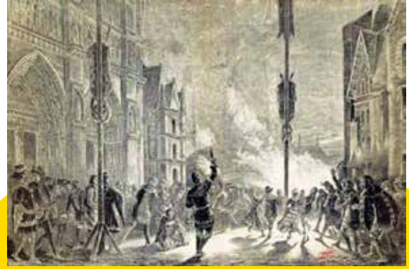
Étienne Marcel operasının üçüncü perdesinden bir sahne: Notre-Dame meydanında şenlik ateşi.

Tabii Çaykovski'nin kendi dramatik eser yazma yeteneğinin ne kadar başarılı olduğu ve Samson ve Dalila için yaptığı günümüze göre hatalı değerlendirmenin diğer eserler için de geçerli olup olmadığı tartışılabilir.