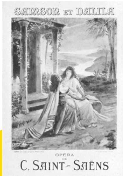
Samson ve Dalila operasının afişi.

İlk gösterim: Weimar Grand Ducal Theatre, 2 Aralık 1877