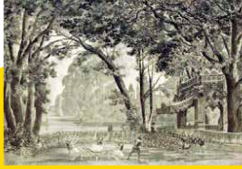
Henry VIII operasından bale sahnesi.

Kral Anne Boleyn'i ihanetle suçlamak isteğiyle yüzüstü bıraktığı eski karısı Catherine'in eline geçmiş olan bir mektubu okumak istemektedir. Ama bütün çabalarına rağmen bunda başarılı olamaz, Catherine ölmeden önce mektubu ateşe atarak yok eder.