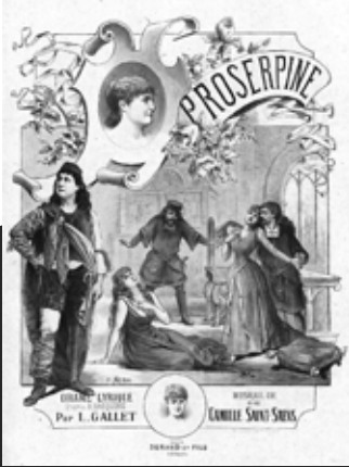
Proserpine operasının afişi.

Saint-Saëns'tan önce yaşamış olan besteciler tarafından opera konusu olarak kullanılan Proserpine (Persefon) eski Yunan mitolojisinden alınan bir öyküdür. Zeus ve bereket tanrıçası Ceres'in (Demeter) kızı olan Proserpine'nin cehennem tanrısı Plüton tarafından yeraltına kaçırılmasından kaynaklanan olaylar üzerine kurulmuştur. Proserpine'nin senenin birkaç ayını Plüton'la beraber geçirmesi zorunluluğu nedeniyle ortaya çıkan tanrılar arası çelişkilerin ve aşkların dinamiğini konu eder.