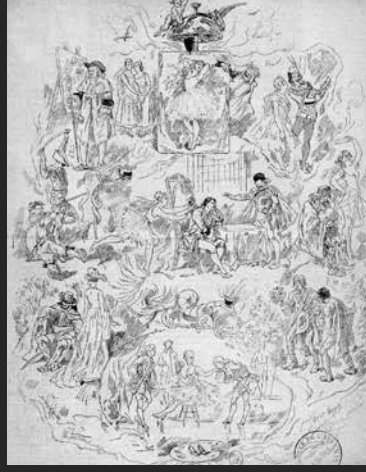
Le Timbre d'Argent'ten sahneler gösteren 1877 tarihli bir gazete kupürü.

Faust'u andıran öyküde Conrad (tenor) adlı ressam, şeytani temsil eden Dr. Spiridon'un (bariton) kendisine verdiği sihirli gümüş çanı kullanarak her istediğini elde edebilmektedir ama gerçekleşen her isteğinin bedeli olarak kendisine yakın bir insanın ölmesi gerekmektedir. Conrad bu koşula razı olur. Kendisi Hélène'le (soprano) nişanlıdır ama Fiametta (balerin) adlı bir dansöze de aşıktır. Fiametta'yı elde etmek için kullandığı çan iki yakın arkadaşının ölümüne neden olur. Sonunda çanı kırmayı beceren Conrad kan ter içinde uyanarak başından geçenlerin bir kabus olduğunu anlar.