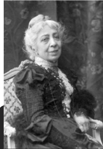
Pauline Viardot'nun yaşlılığı.

Daha önce gösterilen örnekleri olmasına rağmen Paris dini bir konuda yeni bir operanın sahnelenmesine hoş bakmıyordu. İkinci perdeyi beğendirmeyi bir kez daha başarısızlıkla denedikten sonra Saint-Saëns projeyi rafa kaldırdı. Ancak 1872'de üçüncü operası "Sarı Prenses"i gösterilmesinden sonra bu operaya geri döndü. 1875'de eserin birinci perdesi Paris'te konser şeklinde verildi. Bu halktan ilgi görmediği gibi eleştirmenler tarafından da hiç sevilmedi.