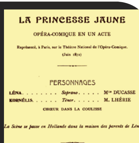
Saint-Saëns'in ilk sahnelenen operası (1872) La Princesse Jaune (Sarı Prenses).

Saint-Saëns özgeçmişinde bu eserin oluşumunu şöyle anlatıyor: "Japonya çok yakın bir zaman önce 'Batı'ya açılmıştı. Japonya ve Japon olan herşey bir çığlık düzeyinde modaydı. Librettistim Louis Gallet ile beraber bir Japon operası yapmaya karar verdik ama Opéra-Comique'in yönetmeni Camille du Locle'ye tamamen Japon temalı bir operayı sahnelemek biraz riskli geldi. Konuyu biraz sulandırmamızı istedi. Onun isteği yönünde mekanı Hollanda'ya taşıdık. Böylece bu küçük yapıt 'Sarı Prenses' adıyla yarı Japon yarı Hollandalı bir opera olarak ortaya çıktı."