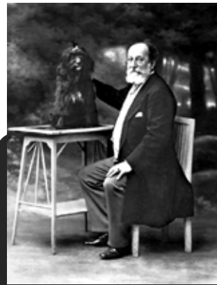
Camille Saint-Saëns, Dalila adını verdiği köpeği ile.

Operanın en tanınan yerlerinden olan ve enstrümental uyarlaması günümüzde de konser programlarında yer alan son perdenin oryantal dansı "Bacchanale" önceleri bir Türk marşı olarak düşünülmüştü. Oba ile başlayan ve Dalila'nın dansına eşlik mahiyetindeki bu parça daha sonra orkestranın başlattığı ve vurmali çalgıların güçlendirdiği ritmik bir yapıya ulaşır.