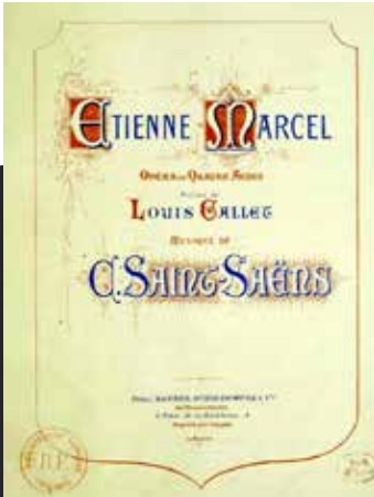
Saint-Saëns'in dördüncü operası Étienne Marcel'in nota kapağı.

Eser ilk kez 1979'un başında Lyon'da gösterildi. Prömiyere Paris'ten gelmiş müzisyenlerin de aralarında bulunduğu çok sayıda seçkin izleyici davet edilmişti. Saint-Saëns'in dinleyiciler arasında bulunduğu icrada orkestrayı Alexandre Luigini yönetti. Artık hatırı sayılır ün sahibi olan bestecinin böyle büyük çaplı bir eserinin başkent Paris değil de Lyon gibi küçük bir şehirde veriliyor olması oldukça ender görülen bir olaydı.