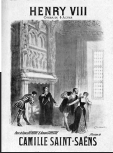
Henry VIII operasının afişi.

Kendisi 1880 yılında Londra'yı ziyaret ettiğinde Buckingham Sarayının müzik arşivlerini de gezmiş ve burada önemsiz bulunduğu bazı notaların arasında bir inci, kendi deyimiyle "enfes bir melodi" görmüştü. Operanın ana temalarından biri, kısa üvertürde de detaylı bir şekilde işlenen bu melodi üzerine kurulmuştur. Daha sonra Will Foster'ın Virginal Book'undan olduğu belirlenen bu nota günümüzde British Library'de bulunuyor.