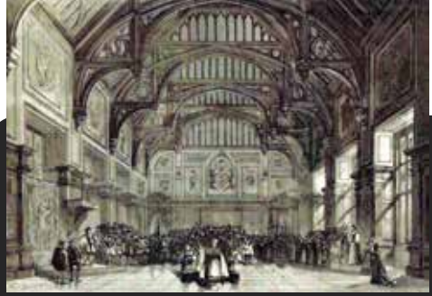
Henry VIII operasında kralın boşanma sahnesi.