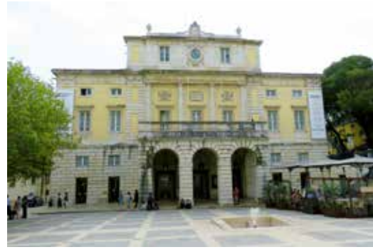
Lizbon Ulusal Tiyatrosu Teatro Nacional de São Carlos'un ön cephesi ve meydanı.

1780'lerde bestelediği tek perdelik komediler ve üç de Portekizce operadan sonra sekiz sene İtalya'da yaşayan besteci burada, özellikle Floransa'da ve Venedik'te gösterilen komik operalarıyla "Marco Portogallo" adı altında büyük başarı kazandı. Eserleri günümüzde uluslararası repertuvarda yer almıyor. Zamanında ün kazanan eserleri arasında şunlar var: La confusione della