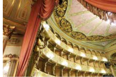
Kraliyet locasından sahneye doğru balkondaki localara bakış.