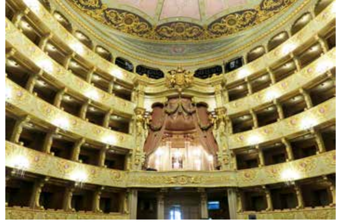
Sahneden kraliyet locasına doğru bakış.

Günümüzde Teatro Nacional de São Carlos'ta gösterilen eserler klasik repertuvardan modern eserlere kadar geniş bir yelpaze oluşturuyor. 2019-2020 sezonunda yer alan operalar şöyle: La Forza del Destino (Verdi), Orfeo ed Euridice (Gluck), Maria Stuarda (Donizetti), Die Walküre (Wagner), Trilogia das Barcas (Santos), La Bohème (Puccini), Le Comte Ory (Rossini). Bunlardan Trilogia das Barcas , Portekizli besteci Joly Braga Santos'un (1924-1988) üç operasından biri. Portekizce olan metin 6. yüzyıl başında yaşayan şair Gil Vicente'nin üç oyunu temel alınarak yazılmış. Zamanın