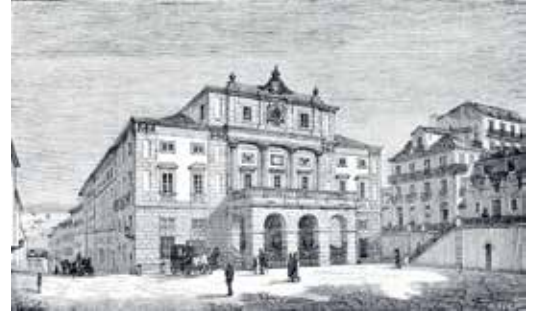
Lizbon'un operası Teatro Nacional de São Carlos'un ön cephesinin 1878 yılında görünümü.

somiglianza (1793), Demofoonte (1794), La Donna di genio volubile (1796) ve Le Donne Cambiate (As Damas Trocadas) (1797). İlginç bir nokta da 1799'da Venedik'te Figaro'nun Düğünü (La pazzo giornata, ovvero Il matrimonio di Figaro) adlı operasının sahnelenmiş olması. Bu opera Beaumarchais'nin eserine dayalı, Mozart'ın çok sevilen Figaro'nun Düğünü (1786) operasının bir başka adaptasyonuydu.