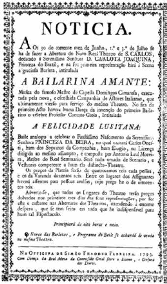
Teatro Nacional de São Carlos'un 30 Haziran 1793 tarihli açılış programının duyurusu.

tiyatrolarında ve çok daha kısıtlı bir şekilde devam etti. Bu saray tiyatroları da parasızlıktan 1792'de kapandı.