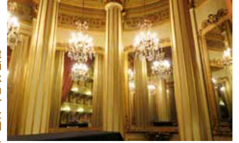
Kraliyet locasındaki neo-klasik sütunlar, altın kaplamalar ve Portekiz yapımı kristal avizeler.