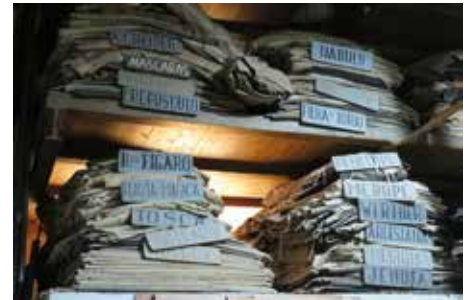
Sahne arkasında korunan opera dekorları.

toplumunda kimin cennete kimin cehenneme gideceği üzerine kurulmuş bu oyunlar da devrin toplumsal eleştirisi olarak kabul ediliyor.