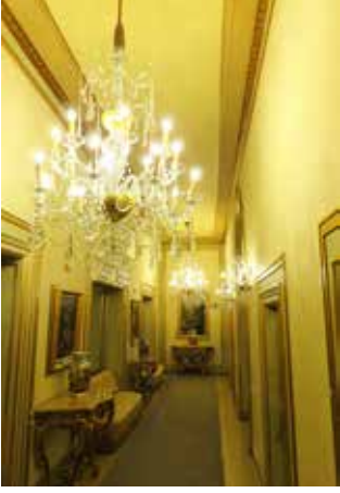
Teatro Nacional de São Carlos'un koridorlarını süsleyen Portekiz yapımı kristal avizeler.

yangında büyük hasar görürken bina komşu yapılar ile arasındaki mesafe sayesinde yanmaktan kurtuldu. 1946'da devlet kontrolü altına giren tiyatro, günümüzde İtalya dışındaki en güzel İtalyan tarzı opera salonları arasında kabul ediliyor.