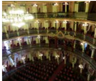
Parterin avizesi ve salona yukarıdan bakış