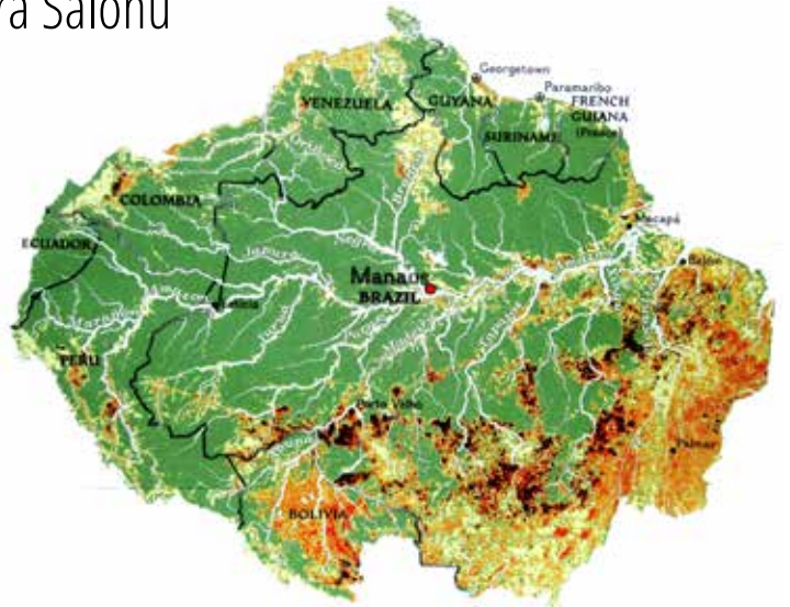
Amazon nehri ve Amazon yağmur ormanının ortasındaki Brezilya kenti Manaus'un konumu.

2016 yazında Manaus'u ziyaret etme şansım oldu. Şehrin etrafını kale duvarı gibi saran Amazon ormanlarında envai çeşit vahşi hayvan izlenebiliyor: Timsahlar, yılanlar, maymunlar, pembe yunuslar, piranalar, yumruk kadar örümcekler, papağanlar, başka hiç bir yerde göremeyeceğiniz