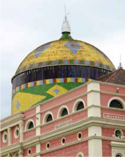
Amazon'un (ve Brezilya bayrağının) renkleri olan yeşil ve sarının kullanıldığı 36.000 kubbe fayansı Teatro Amazonas için özel olarak Alsace'da yapıldı.

Cumhuriyetin damgası vuruldu. Operanın ilk yıllarında monarşi fikrini aklından atamamış olan Manauslular için bu Cumhuriyet fikirli kubbenin güzel görünmediği muhakkak.