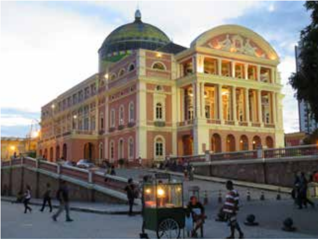
Manaus'un gururu Teatro Amazonas.

Kauçuk endüstrisinin Avrupa'dan Manaus'a çektiği çok sayıda servet avcısı arasında İngilizler, Almanlar, İtalyanlar ve Fransızlar çoğunluktaydılar. Orta ve Uzak Doğu'dan işçiler getirildi. O kadar ki, o günlerde gelen yabancı işçiler için kurulmuş olan bir İslam Merkezi ve Camii günümüzde bile faaliyette.