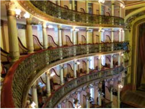
Balkon: Locaların görünüşü.

31 Aralık 1896 tarihinde açılan Teatro Amazonas, 1889'da Brezilya Cumhuriyeti'nin bir parçası olan Amazonas eyaletinin eriştiği sosyo-ekonomik ve kültürel düzeyin bir simgesi oluyor. Bu refah dönemi boyunca Manaus şehrinin zengin kültür hayatını yansıtan etkinliklere ev sahipliği yaptı.