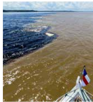
Manaus yakınında "Suların Buluşma Yeri" ("Encontro das Águas") olarak bilinen ve Rio Negro (solda) ve Rio Solimões'un (sağda) birleşerek dev Amazon nehrini oluşturdukları yer.

Manaus şehri coğrafi konumuyla Amazon nehri kıyısında değil, Rio Negro adlı nehir üzerinde (kaynağı Kolombiya'da) kurulmuş. Manaus'un hemen yakınlarında, herkesin Amazon ama Brezilyalıların Rio Solimões (kaynağı Peru'da) adını verdikleri nehir, kuzeyden gelen Rio Negro nehri ile buluşuyor ve bu iki nehir dev Amazon nehrini oluşturuyorlar. İşte Manaus yakınındaki bu iki nehrin buluştukları yer; "Suların Buluşma Yeri" ("Encontro das Águas") gerçekten görmeye değer.