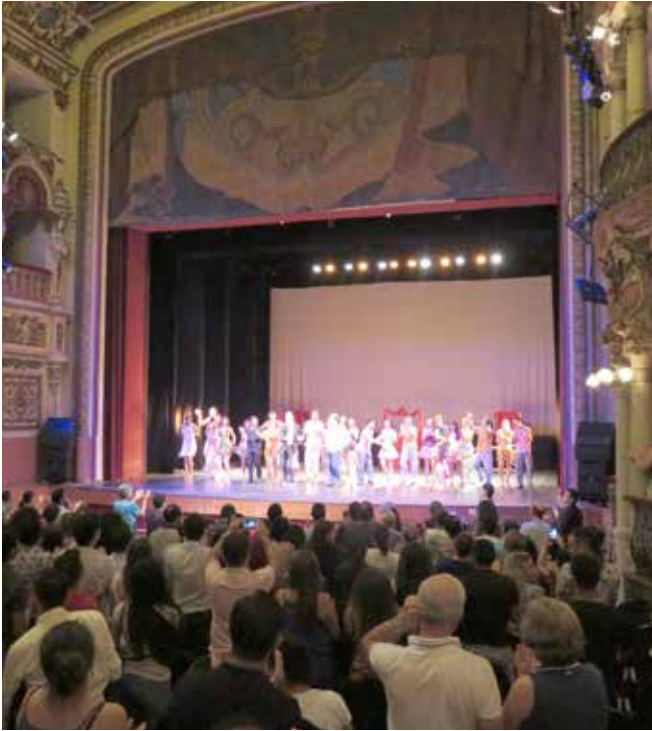
2016 yılının Haziran ayında Teatro Amazonas'ta bir dans topluluğunun gösterisinden sonra alkış alan sanatçılar.

Teatro Amazonas her Mayıs ayında uluslararası bir opera festivaline ev sahipliği yapıyor. Bunun yanı sıra bale, geleneksel dans, sinema, caz ve klasik müzik festivalleri de yapılıyor. 2016 yılında tiyatrunun kuruluşunun 120. yılı kutlanırken oradaydım. Bu vesileyle, yapılan etkinliklerden yerel bir topluluğun dans gösterisini izleme fırsatını buldum. Böylece o eski koltuklarda izleyici olarak oturma ayrıcalığını da yaşadım.