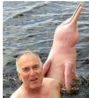
Yazar Manaus yakınında Rio Negro'da pembe tatlısu yunuslarıyla haşır neşir olurken. Haziran, 2016.