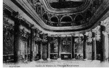
Solda: Teatro Amazonas'ın lobisi, 1907. Mermer görünümlü sütunlar aslında dökme demirden yapılmış. Bu sütunlar İskoçya'nın Glasgow şehrinde imal edilerek deniz ve nehir yoluyla Manaus'a getirilmiş. Sağda: Teatro Amazonas'ın lobisinin görünümü, Haziran 2016.