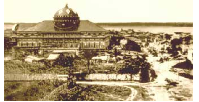
Teatro Amazonas'ı inşaatının son safhalarında gösteren bir fotoğraf, 1896.

Dikkat edilmesi gereken bir nokta: Operanın klima sistemi sadece performans süresince açılıyor, dolayısıyla binayı gezerken boğucu bir sıcakla mücadele etmek durumundasınız.