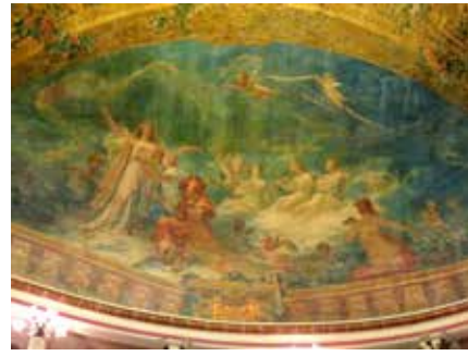
Tavandaki müzik, dans, tiyatro ve opera dallarını betimleyen resimlerden sahne üzerinde yer alan "müzik" temalı resim.

Manaus silinirken büyümeye devam eden Rio de Janeiro, São Paulo ve Belo Horizonte gibi şehirler Manaus'u geride bıraktılar, zenginleştiler, ülkenin geleceğinde daha önemli rol oynamaya başladılar.