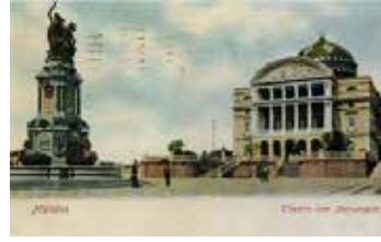
Solda: Manaus São Sebastião Meydanı ve Teatro Amazonas, 1906. Sağda: São Sebastião Meydanı ve Teatro Amazonas, 2016.