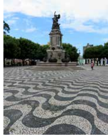
Manaus'taki São Sebastião Meydanı ve limanın açılışı münasebetiyle 1900'da dikilen heykel. Heykelin cepheleri dünyanın dört kıtasına ayrılmış: Afrika, Avrupa, Asya ve Amerika. Meydanın taşları ise Manaus'un yakınlarında "Suların Buluşma Yeri"nde bir araya gelerek Amazon'u oluşturan koyu renkli Rio Negro ve açık renkli Rio Solimões'u temsil ediyor.