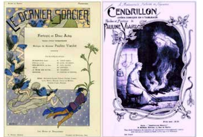
Pauline Viardot'nu iki oda operasının nota kapakları: Son Büyücü ( Dernier Sorcier ) ve Külkedisi ( Cendrillon ).

Viardot bestelediği şarkılarda değişik tarzlar ve diller kullanmıştır. Bu şarkılar kendi sesine uygun olmalarının yanı sıra öğrencileri ve meslektaşlarının da yararlanmaları için düşünülmüştür. Yaşamı boyunca yayımladığı iki yüze yakın şarkıda aralarında Turgenyev , Puşkin , Goethe ve Racine 'in yer aldığı ünlü şairlerin şiirlerini kullandı. Ayrıca Haydn , Chopin , Brahms ve Schubert 'in eserlerinden yaptığı uyarlamalar da çok popülerdi. Chopin'in 12 mazurkası üzerine, bestecinin "çok hoş" olarak değerlendirdiği vokal uyarlamalar yaptı. Schubert'in valslerinin transkripsiyonlarını, Brahms'ın Macar danslarını ve Haydn'in serenatlarının da uyarlamalarını yaptı. Schubert'e büyük hayranlık duyan Viardot, bu bestecinin 50 Lieder 'inin kritik edisyonu üzerinde çalıştı.