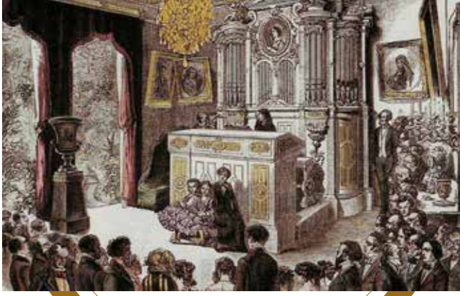
Pauline Viardot'nun Paris'teki müzik salonu.

Pauline Viardot günümüzde yeteri kadar tanınmıyorsa, bunun nedeni zamanının pek çok olağanüstü kadın sanatçısı gibi, şöhretinin etrafındaki erkekler tarafından gölgede bırakılmış olmasıdır.