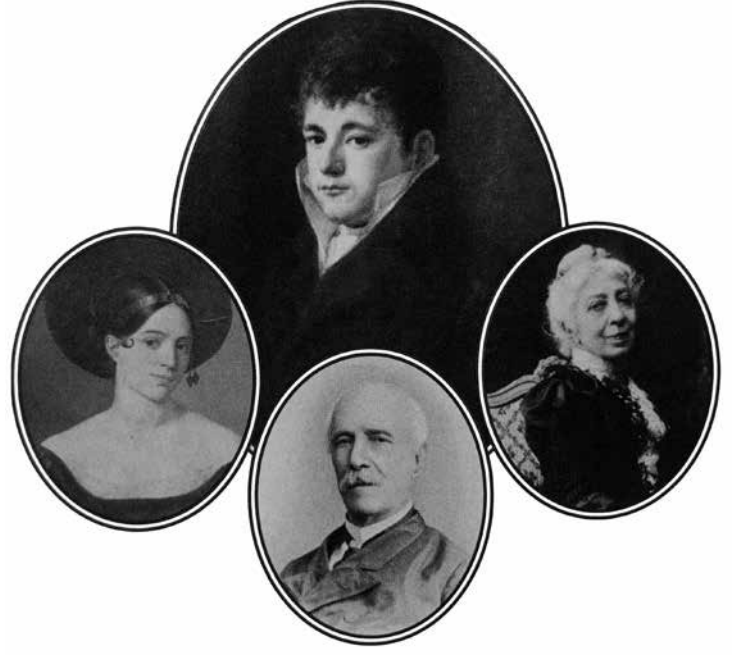
García ailesinin birkaç üyesi: Baba Manuel García (1775-1832), Maria Malibran (1808-1836), Manuel Patricio García (1805-1906), Pauline Viardot (1821-1910).