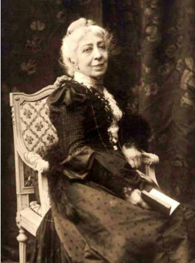
Pauline Viardot 1890 yılında.

Pauline Viardot 18 Mayıs 1910'da Paris'te hayatını kaybetti.