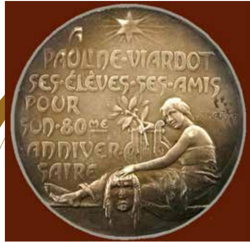
Öğrencilerinin ve dostlarının Viardot'nun 80. doğum günü anısına yaptıkları hatıra madalyonu.

Hector Berlioz, Meyerbeer'in Le Prophète operasının prömiyeri üzerine yazdığı yazıda onu " Müziğin geçmişinde ve günümüzde ortaya çıkan en büyük sanatçılardan biri, " şeklinde değerlendiriyordu. Bu operada da baş rol Viardot için yazılmıştı.