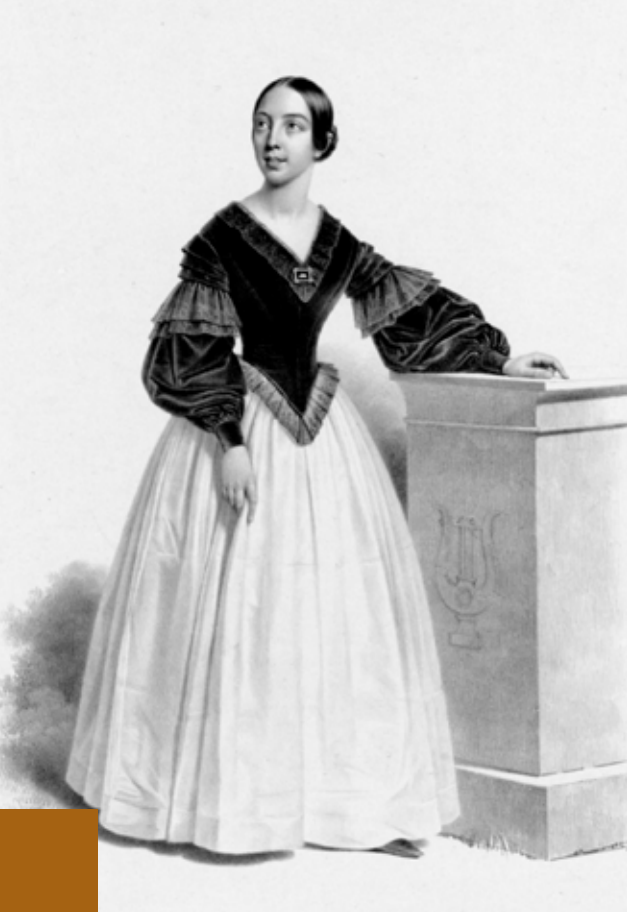
Genç Pauline García, Louis Viardot ile evlendiği 1840 yılında.

Pauline asla "yeni Malibran" olmayacaktı; kız kardeşi gibi dillere destan bir güzelliğe sahip değildi. Sesi olağanüstü geniş bir yelpazeyi kapsamasına rağmen sopranodan çok mezzo rollerine