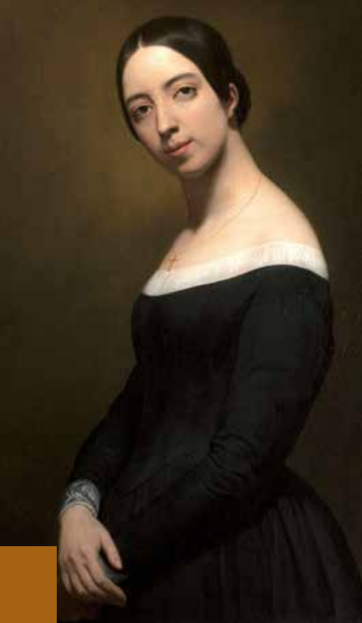
Portrait de Pauline Viardot, 1840: Pauline García - Viardot 1840 yılında (Ressam: Ary Scheffer, Paris, Musée de la Vie Romantique).

İtalyan operasının Amerika'ya gelişi 7 Kasım 1825 tarihinde gerçekleşti. Ünlü İspanyol tenor, besteci ve emprezaryo Manuel García , çocukları, eşi ve rengarenk bir grup İtalyan şarkıcı topluluğu eşliğinde, otuz yedi gün süren bir gemi yolculuğunun ardından Liverpool'dan New York limanına vardılar. García, o zamanlar New York'ta yaşayan Mozart'ın librettisti Lorenzo da Ponte 'nin yardımıyla Yeni Dünya'da bir İtalyan opera merkezi kurma umudundaydı.